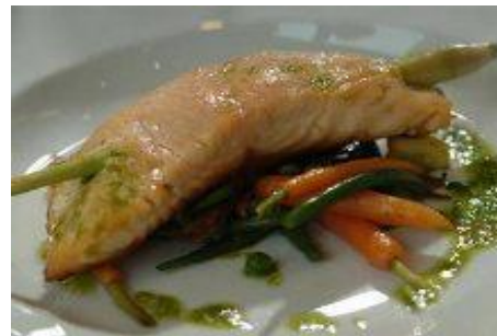
Жареный судак с соусом из раков и картофельным муссом