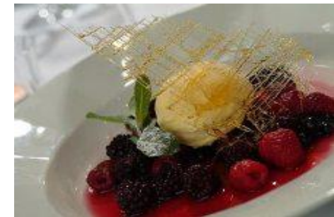
Маринованные лесные ягоды с ванильным мороженым