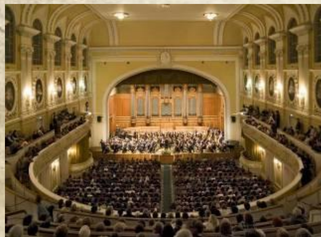
Одесский оперный театр