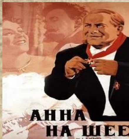
Афишы к к/ф «Анна на шее»