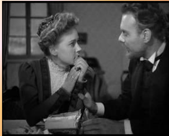
Кадры из к/ф «Дама с собачкой»