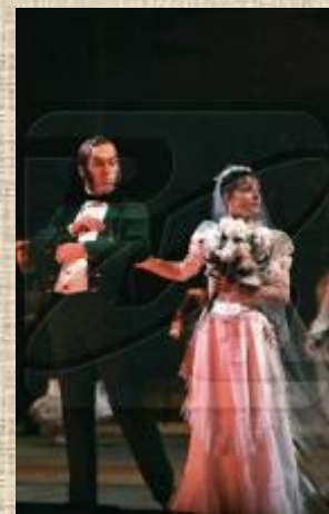
Е.Максимова и М. Цивин в балете «Анюта»