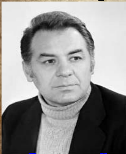
Режиссер Э. Лотяну

Вряд ли кого-то оставит равнодушным фильм режиссера Эмиля Лотяну «Мой ласковый и нежный зверь», снятый по повести «Драма на охоте»