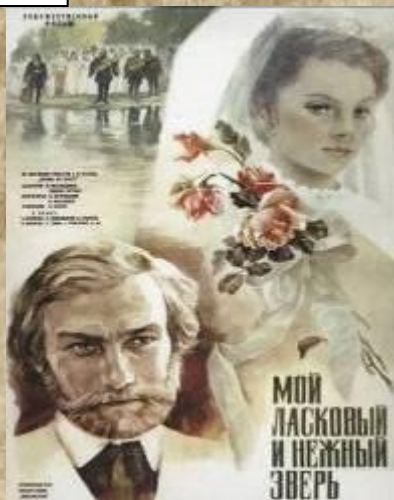
Афиша к/ф «Мой ласковый и нежный зверь»