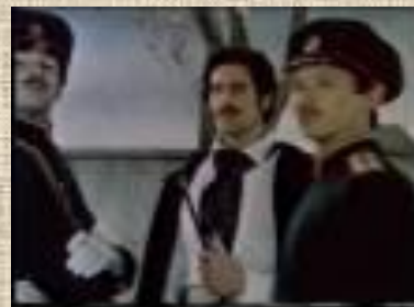
Сцены из балета «Анюта»