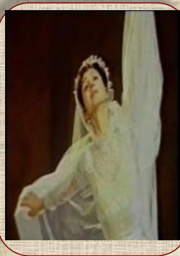
Е.Максимова в балете «Анюта»