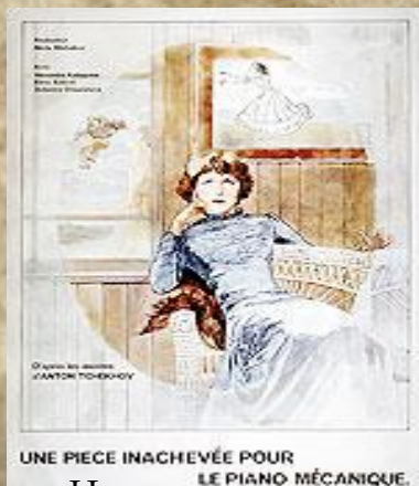
«Неоконченная пьеса для механического пианино»