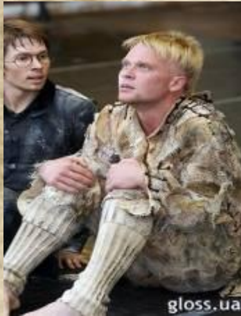
Сцены из балета «Палата №6»