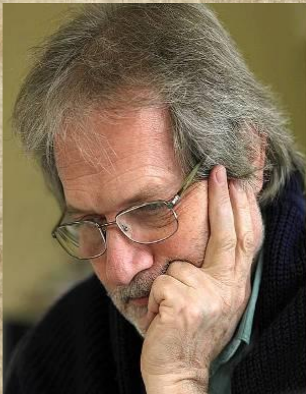
Петер Этвеш, композитор