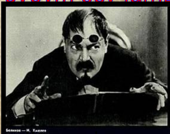
«Человек в футляре», Н.Хмелев в роли Беликова