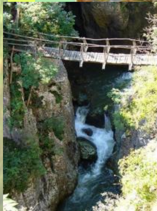
Еменска пещера и каньон