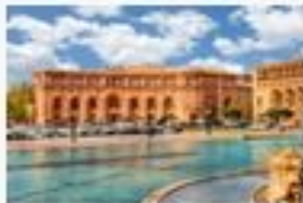
Armenia Marriott Hotel