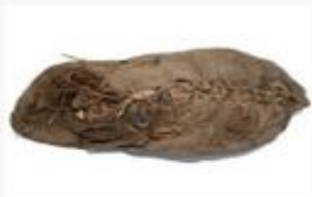
World Oldest Leather Shoe(5500 Year Old)