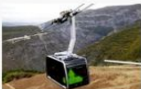
World Longest Cableway "Wings of Tatev"