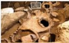
World Oldest Winery(6000 Year Old)