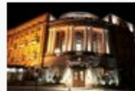
Golden Tulip Yerevan Hotel