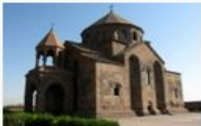
St. Hripsimeh Cathedral