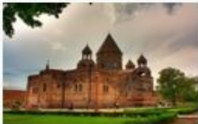
Mother Cathedral of Etchmiadzin