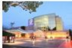
Golden Palace Hotel