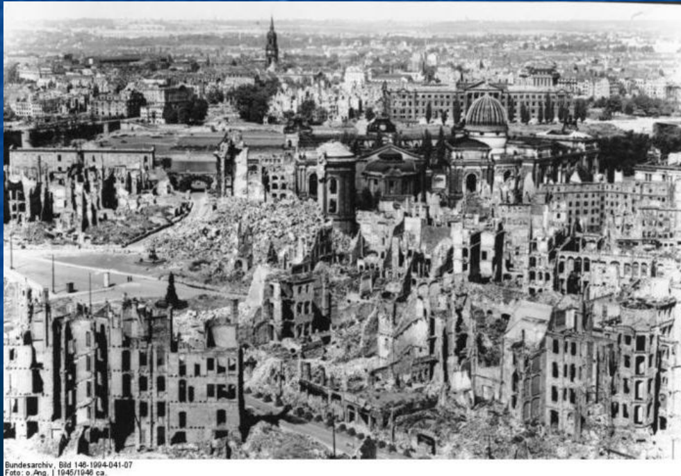
1945/1946 ca.