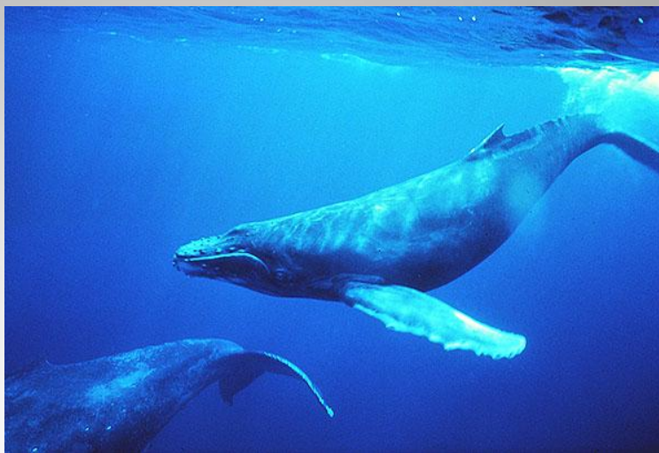
Синий или голубой кит