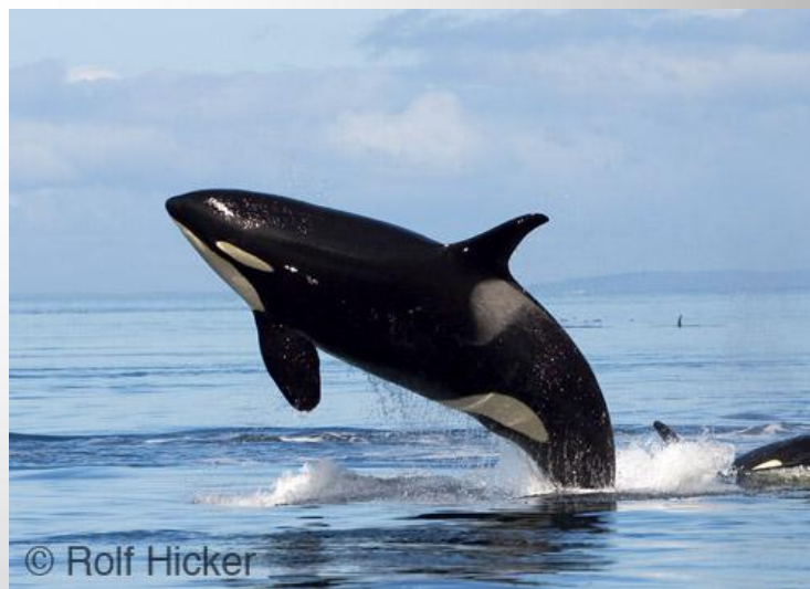
Зубатый кит касатка