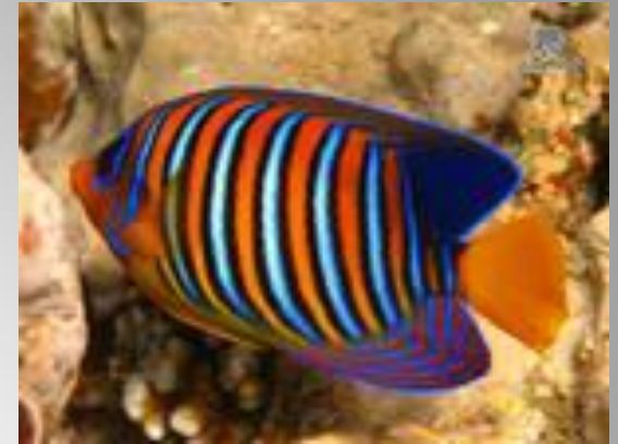
Королевская рыба ангел