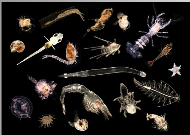
Мелкие планктонные животные