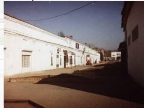
г) торговые ряды на центральной площади