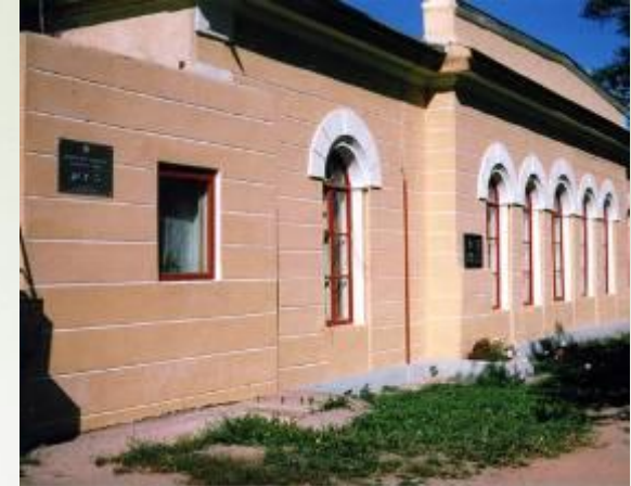
в) Ямская станция