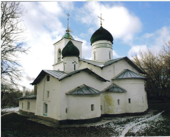
б) Никольский собор