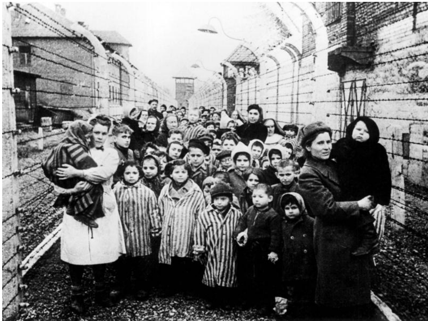
Лагерь в Освенциме (Польша)