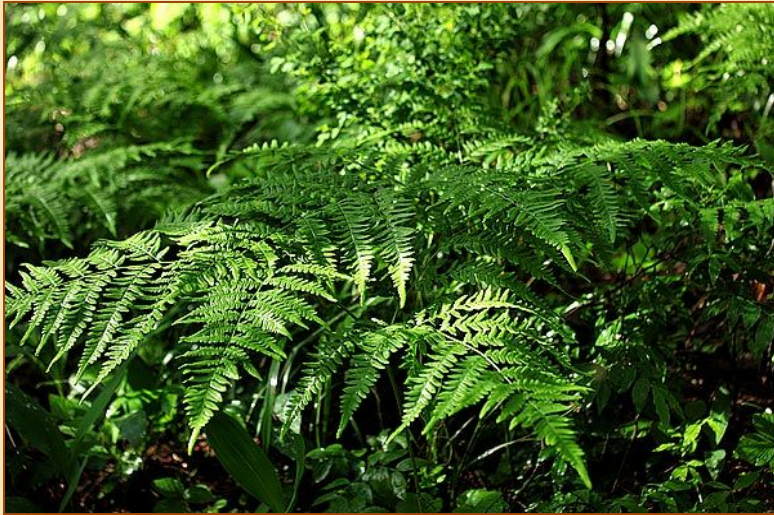
Папоротник Орляк на берегах озер