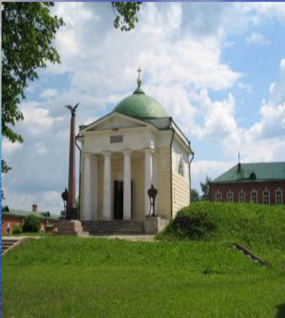
Спасо- Бородинский храм