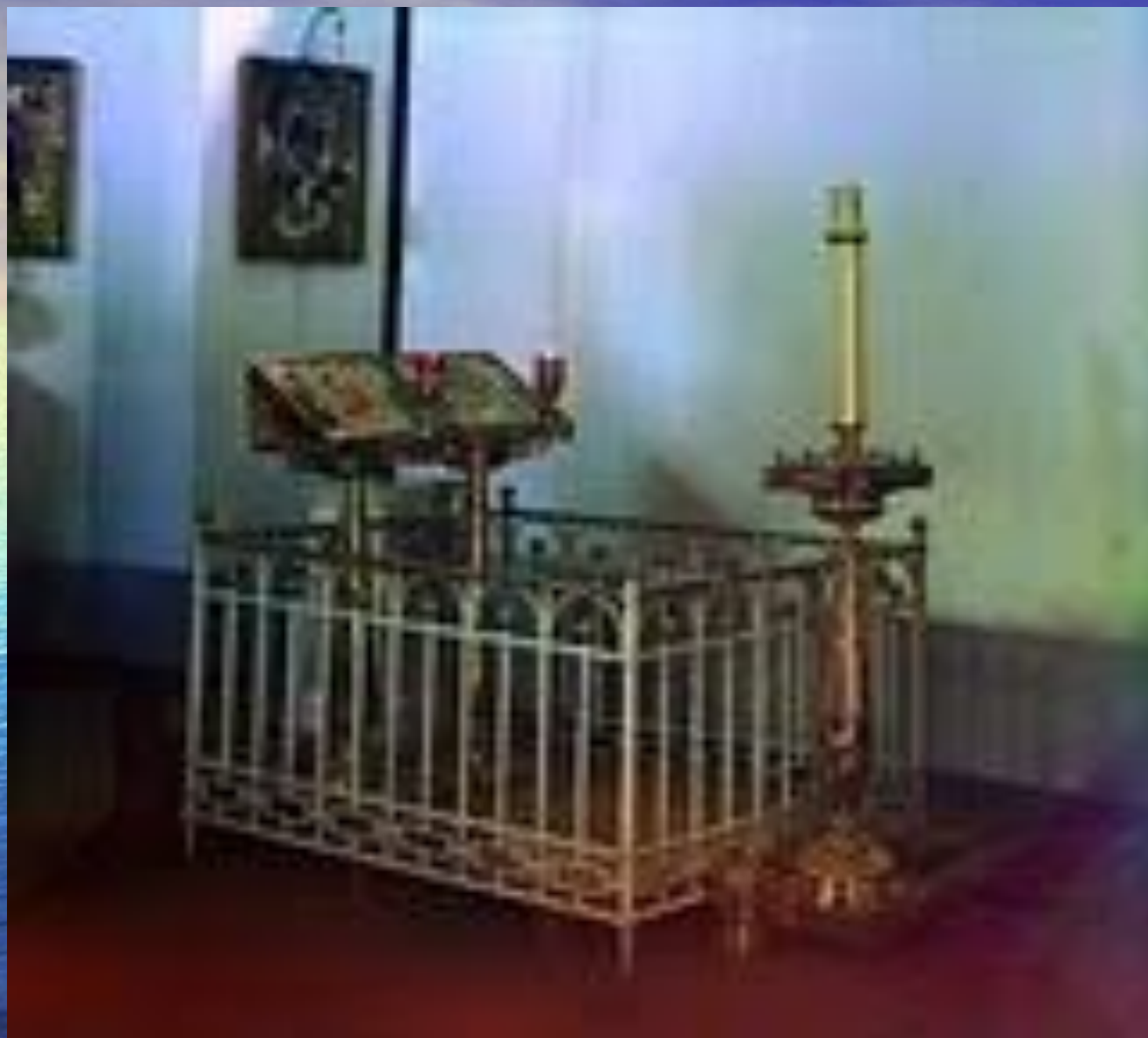
Могила Маргариты Тучковой