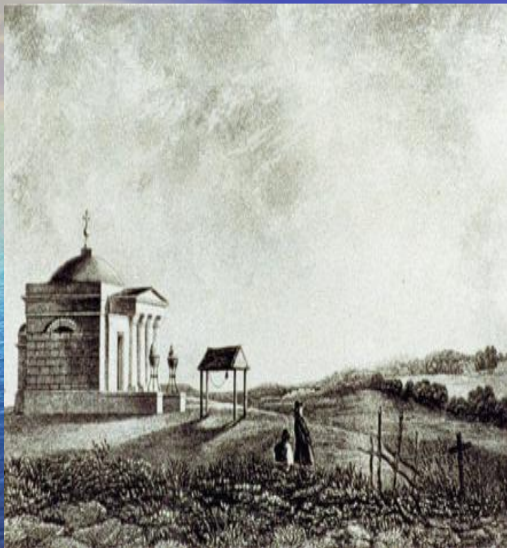
Спасо- Бородинский храм в 1818 году