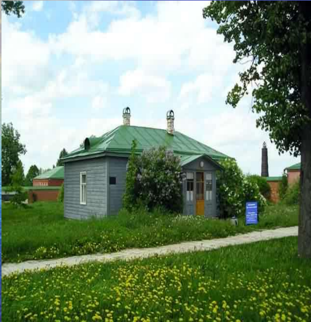
Сторожка Маргариты на Бородинском поле