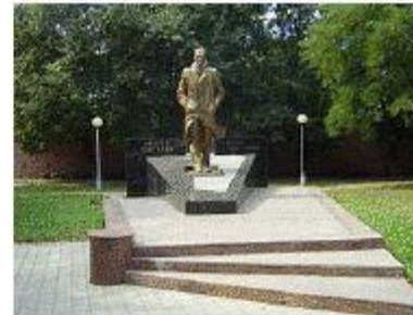
Памятник в Воронеже