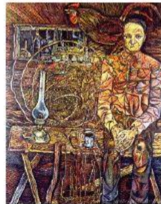
А. Платонов. Художник Н. Ромадин