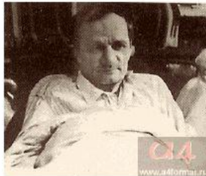
Фото 1951 г.