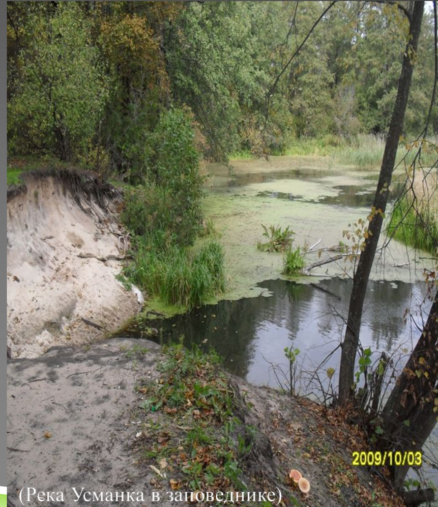
(Река Усманка в заповеднике)

Однородные ландшафты лесостепи подвергались очень сильному и длительному антропогенному воздействию, главным образом из-за плодородных почв. Большая часть лесостепи распахана и интенсивно используется под земледелие - традиционное занятие коренного населения. Местами ещё можно встретить отдельные уцелевшие участки лесостепи. Для охраны и изучения лесостепи созданы национальные парки и заповедники, в том числе Лес на Ворскле и др.