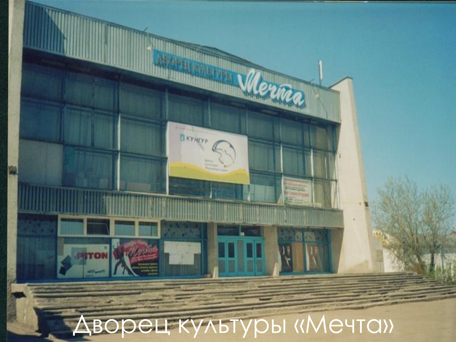
Дворец культуры «Мечта»