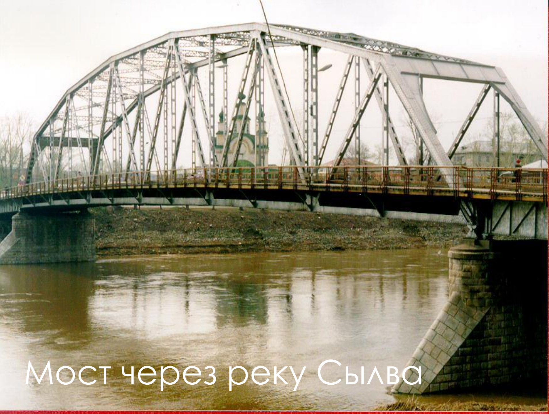
Мост через реку Сылва