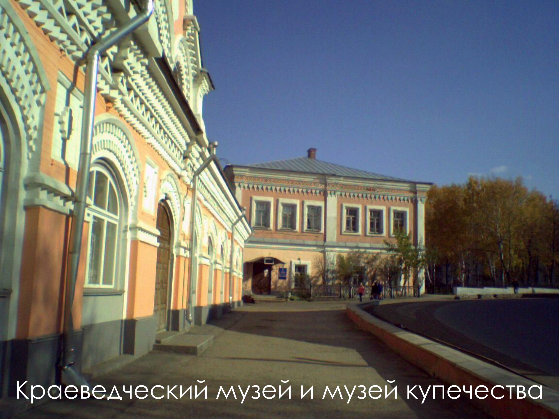
Краеведческий музей и музей купечества