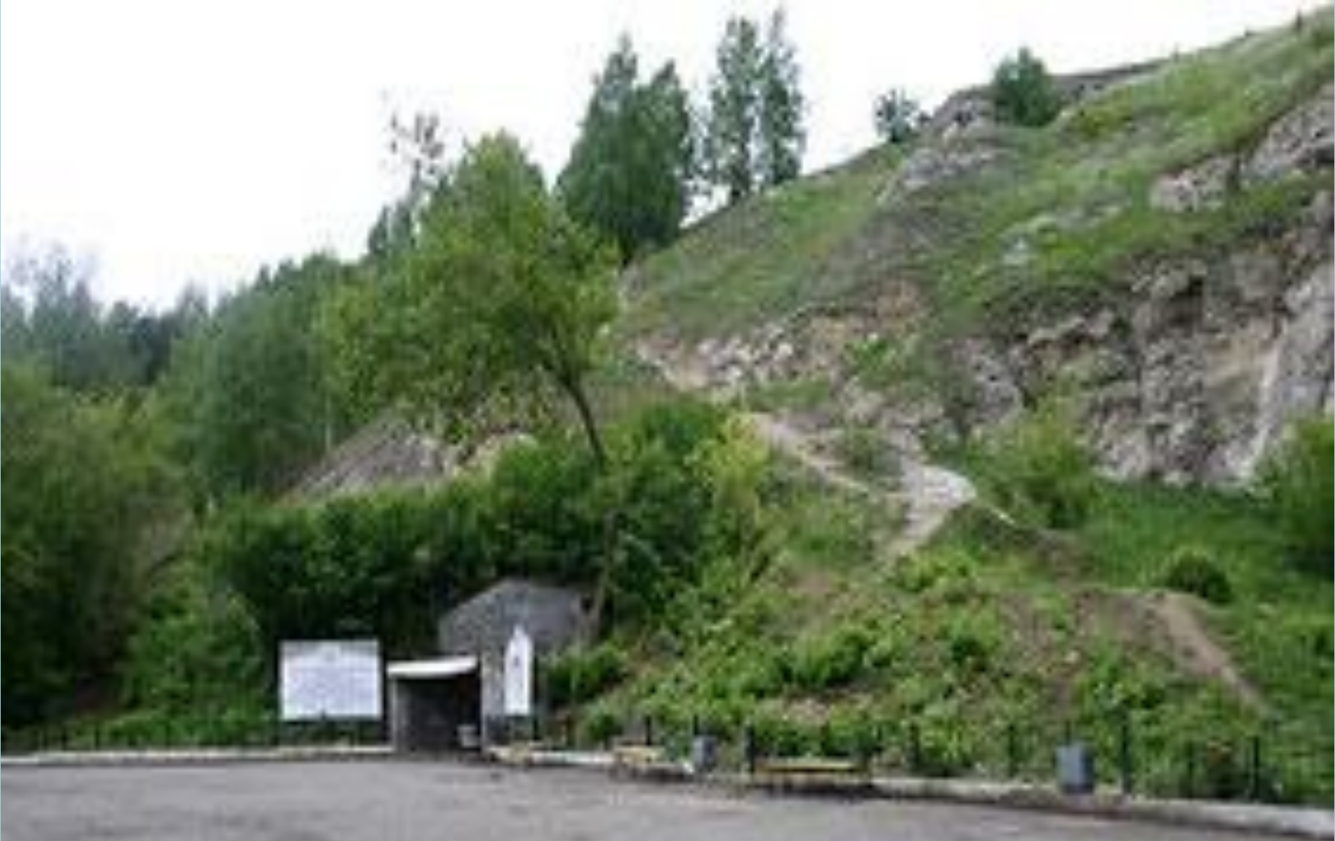
Вход в ледяную пещеру