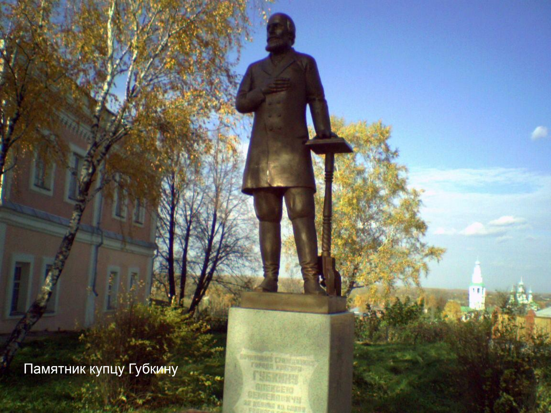
Памятник купцу Губкину