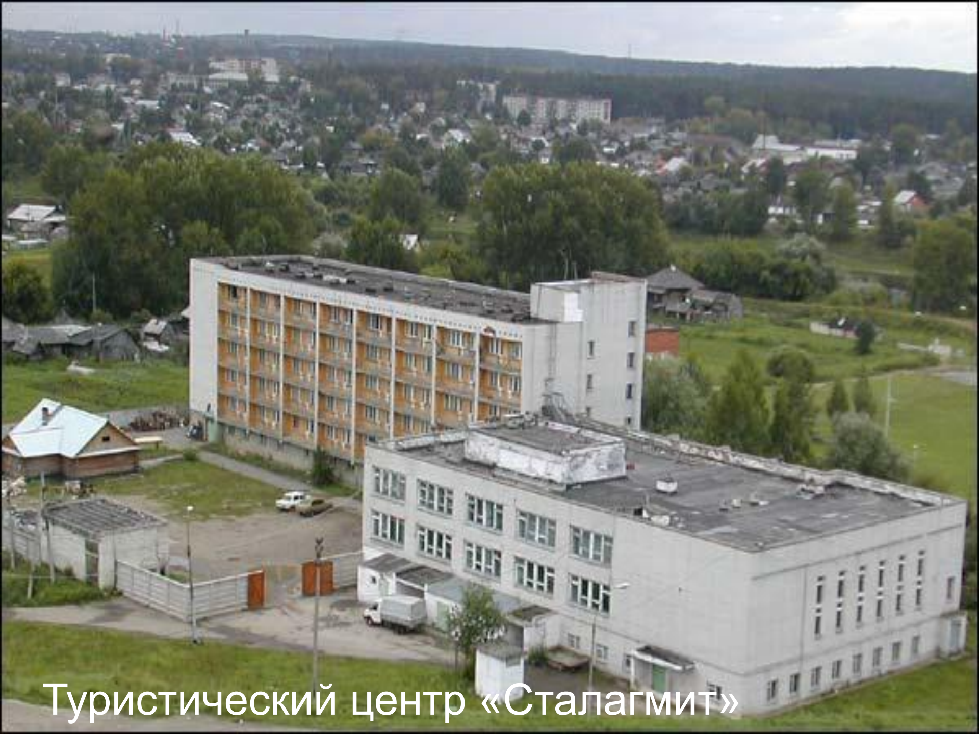
Туристический центр «Сталагмит»