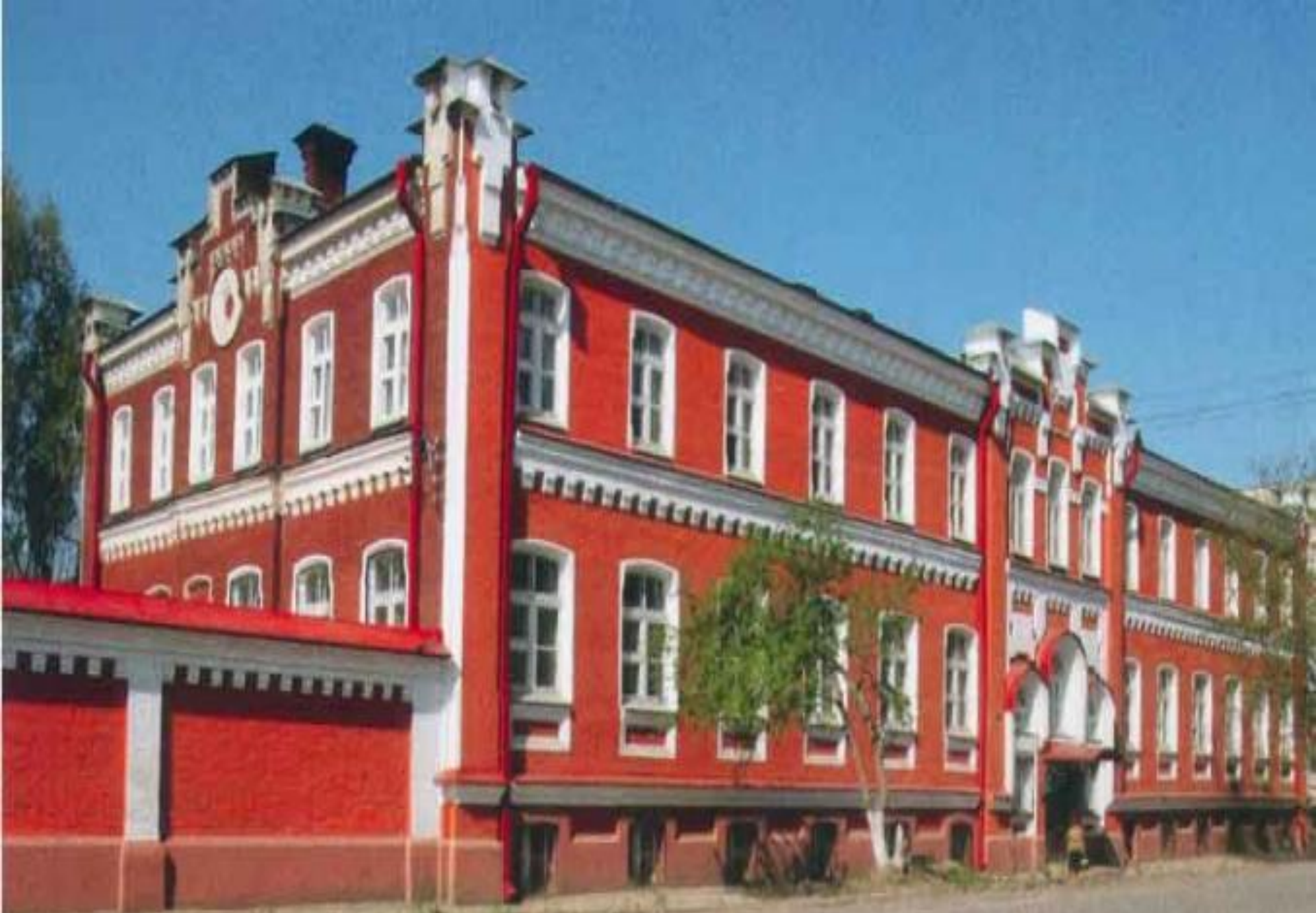
Кунгурское педагогическое училище