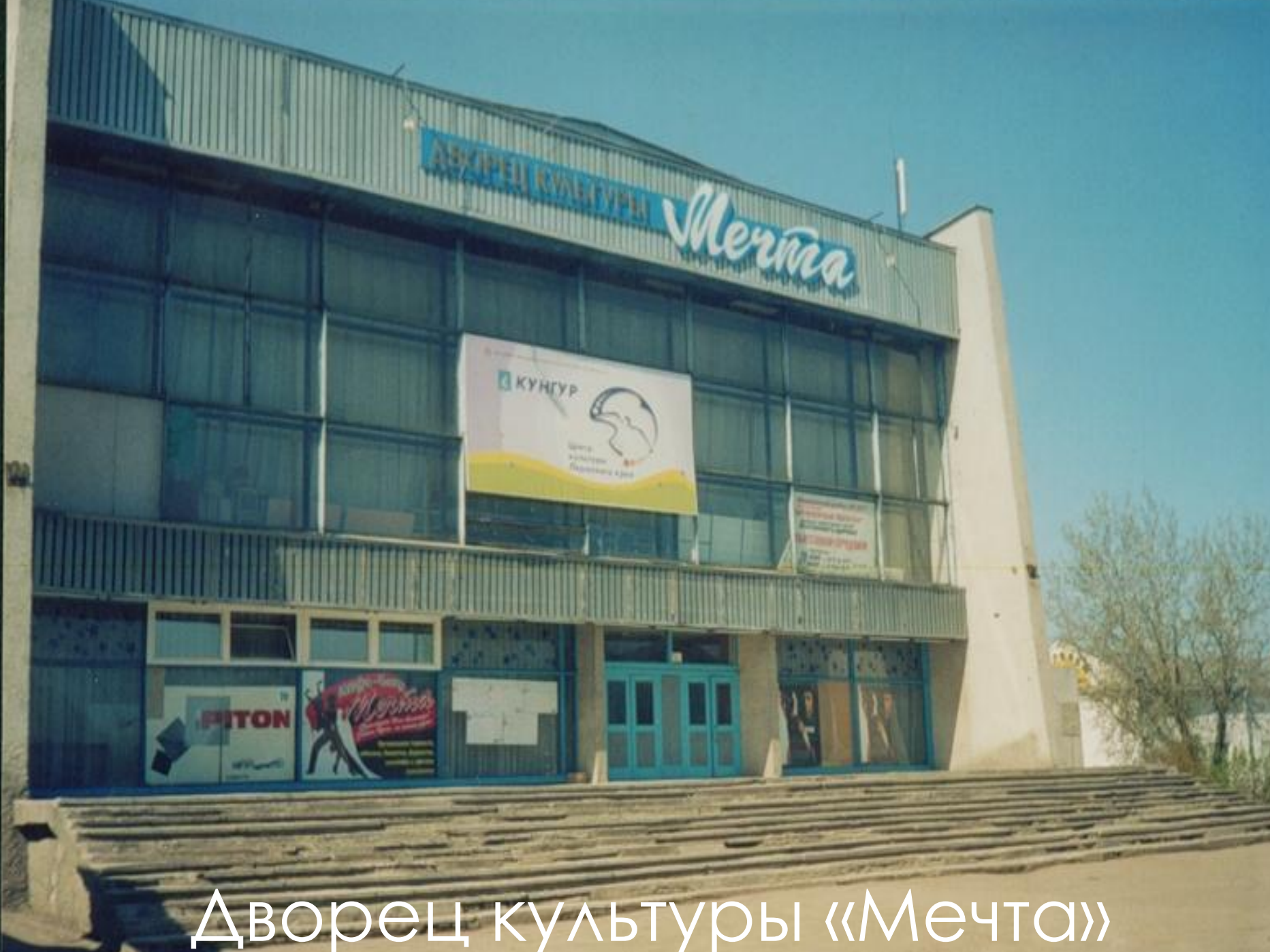
Дворец культуры «Мечта»