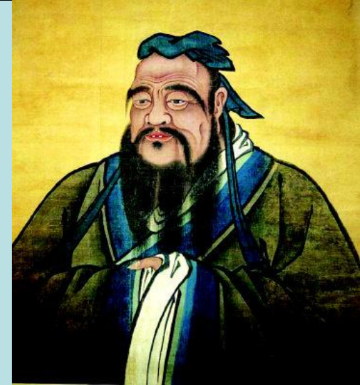
Конфуций (551-479 гг. до н. э.)