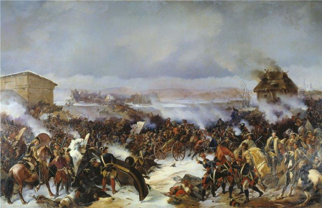
Северная война (1700-1721гг.)

Северная война легла тяжёлым бременем на плечи большинства населения страны. Крестьянство, помимо барщины и оброка, было обложено массой новых государственных повинностей и налогов. Сильное недовольство вызывало насильственное введение европейских традиций, обрядов.