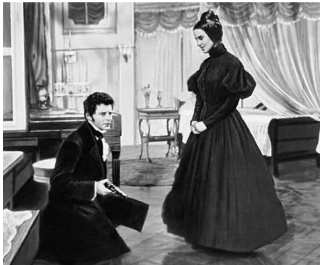
Кадр из фильма Отан-Лара Le rouge et le noir 1954 г.

Роман «Красное и черное», быть может, самый необыкновенный во французской литературе XIX века, прозвучал как грозное предупреждение: настанет время, когда Жюльены Сорели – молодые плебеи, умеющие пылко мечтать о лучшем будущем и бесстрашно бороться за свое счастье, – сумеют найти верный путь!