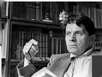
АБРАМОВ Федор Александрович