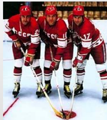
Б.Михайлов, Петров и Харламов