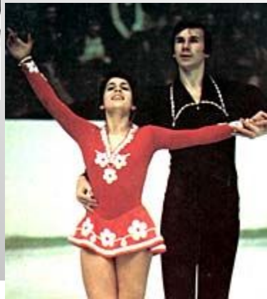
И.Роднина и А.Зайцев