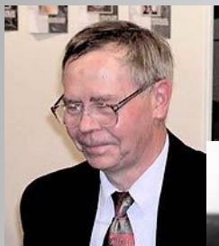
РАСПУТИН Валентин Григорьевич