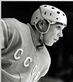
Александр Мальцев – один из лучших хоккеистов в мировом хоккее.