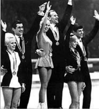
Парное катание: Л.Белоусова и О.Протопопов