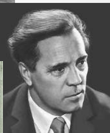
АСТАФЬЕВ Виктор Петрович