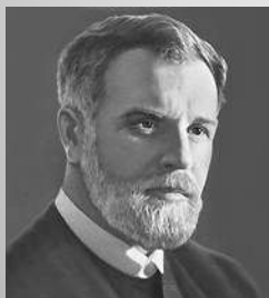
БЕЛОВ Василий Иванович