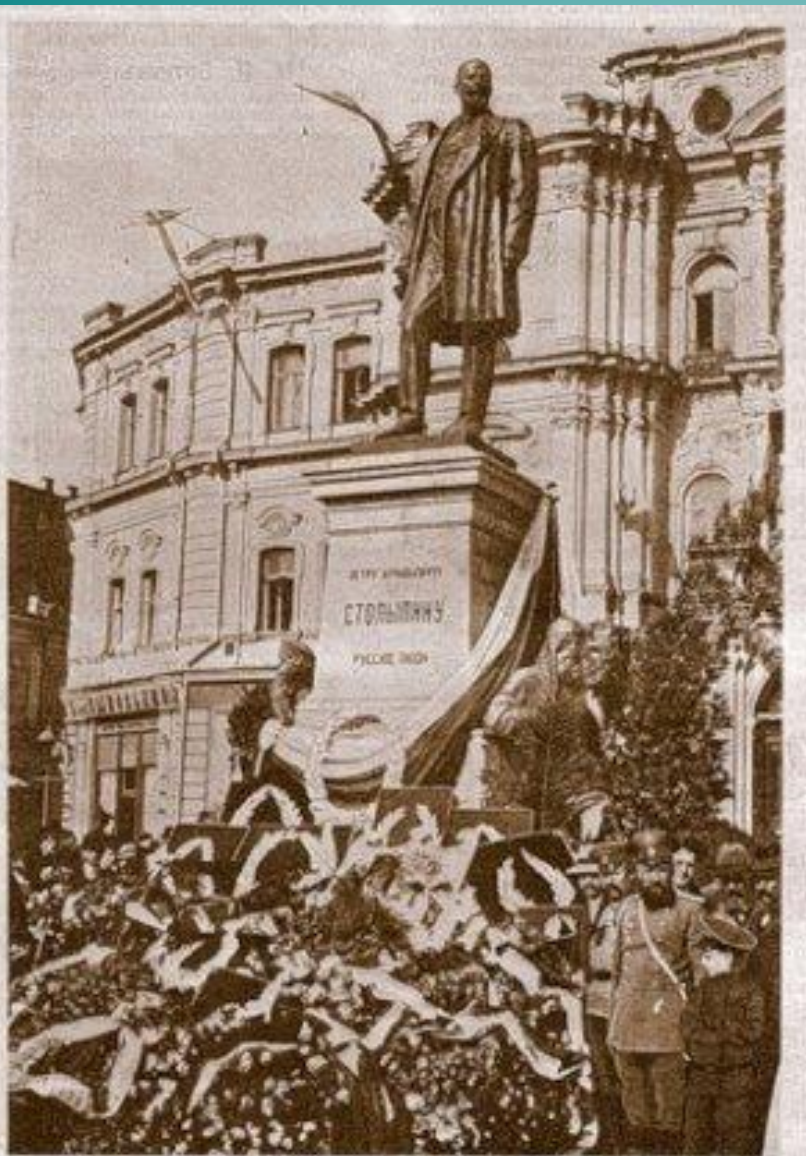
Открытие памятника покойному председателю Совета Министров П. А. Столыпину, в г. Киеве, 5 октября с. г. Памятник высотой 12 аршин. Представил скульптор из Санкт-Петербурга. По сторонам памятника аллегорические фигуры Мудры (русская женщина) и Силы (русская женщина). Памятник воздвигнут на главной улице Киева, Крещатке, против здания городской думы. Все сооружение обошлось в 120 тыс. руб. На открытии памятника съезжались министры, члены Гос. Совета и Гос. Думы разных политических фракций, многочисленные депутаты и другие должностные. Через два дня, 7 октября, состоялось закладка цркви в г. Столыпина в Киев, гуд. в г. Санкт-Петербургской женщины П. А. Столыпина.