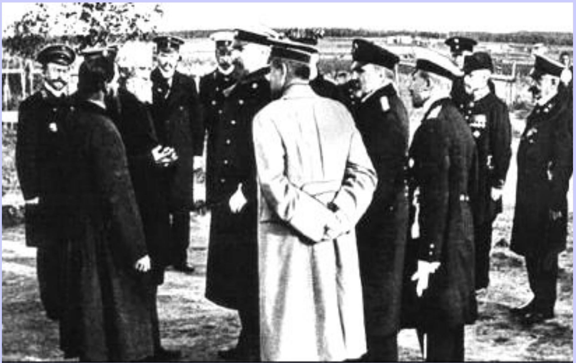
П. А. Столыпин в гостях у Иудея