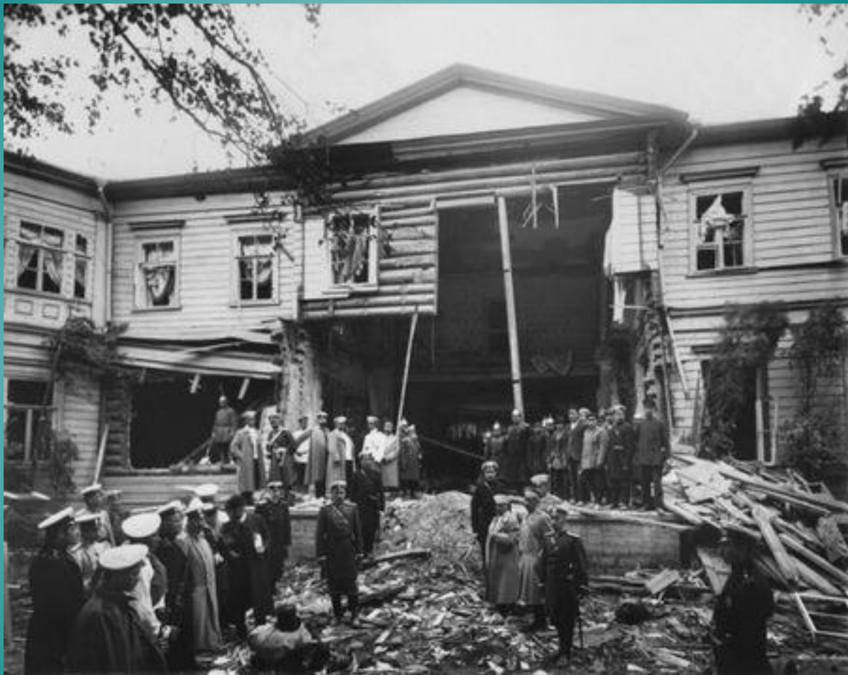
Дача Столыпина после взрыва. Август 1906 г.