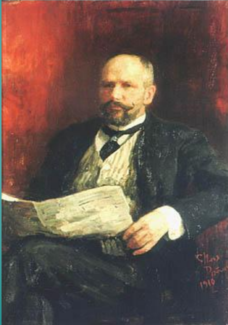
Петр Аркадьевич Столыпин(1862-1911)