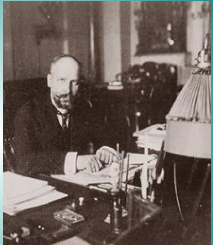
Одна из последних фотографий Столыпина. 1911 г.