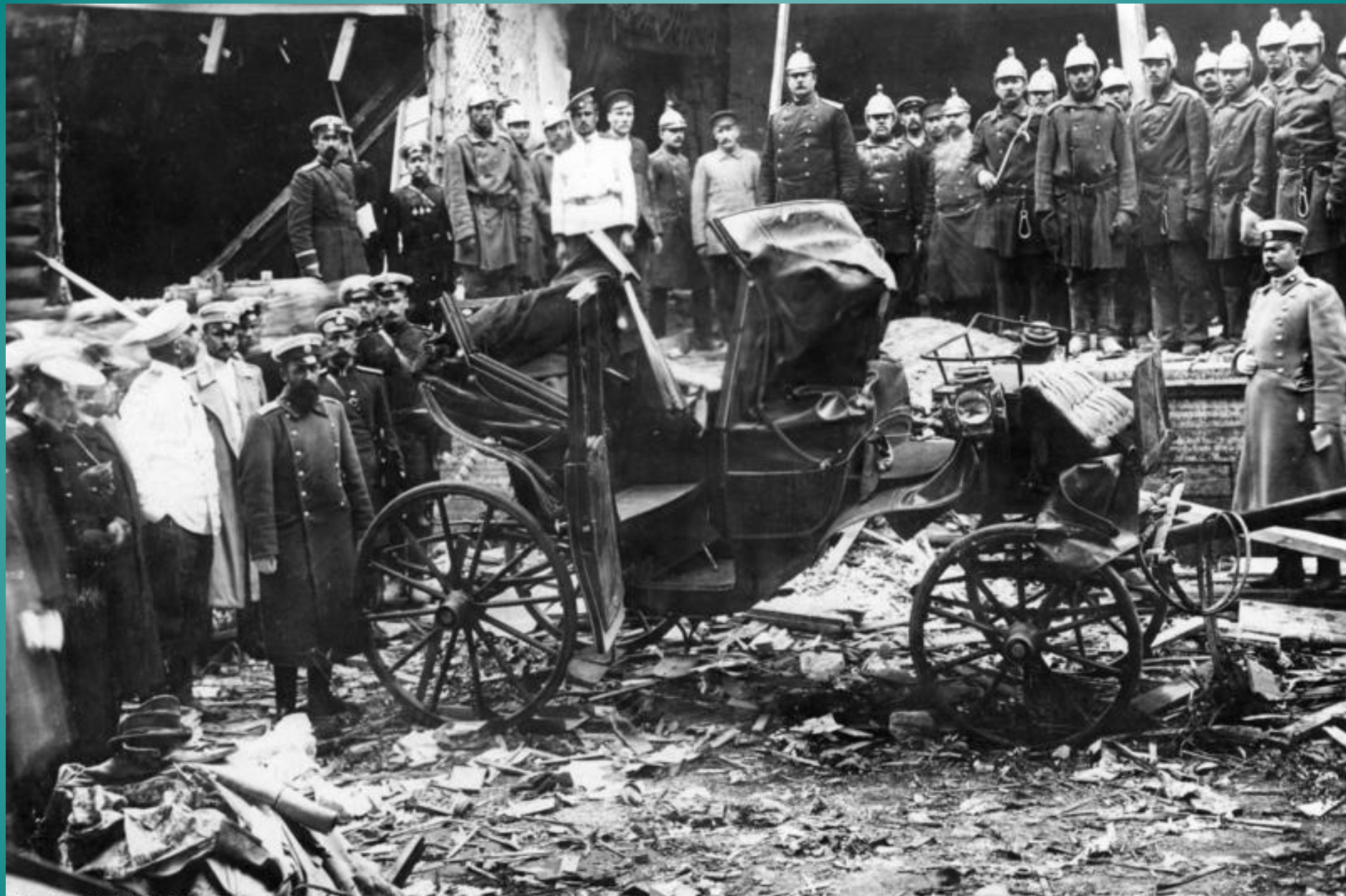
Bundesarchiv, Bild 183-R04510 Foto: o. Ang. | August 1906