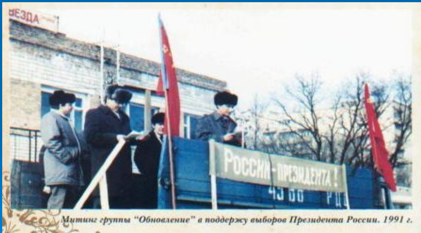
Митинг группы "Обновление" в поддержку выборов Президента России. 1991 г.