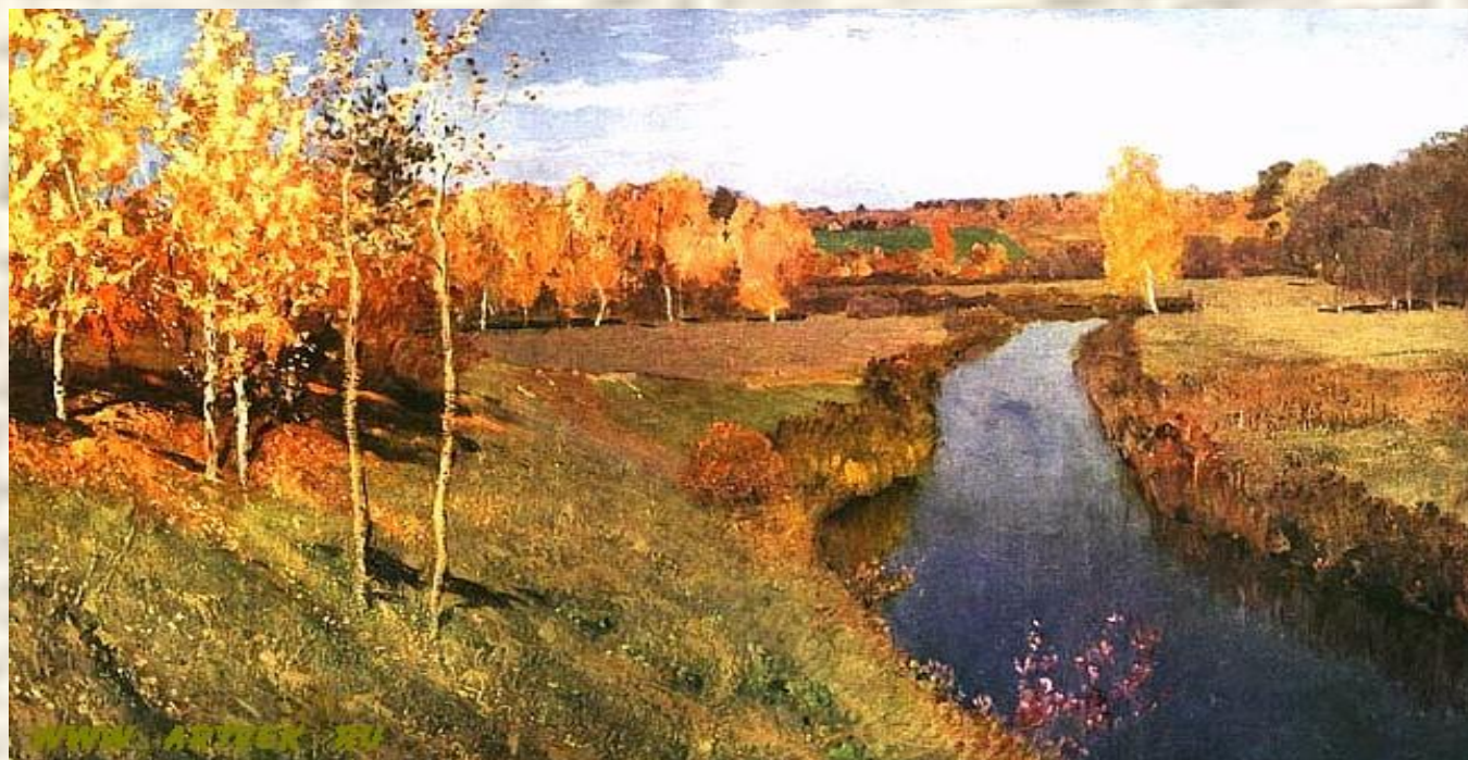
И.И. Левитан «Золотая осень»