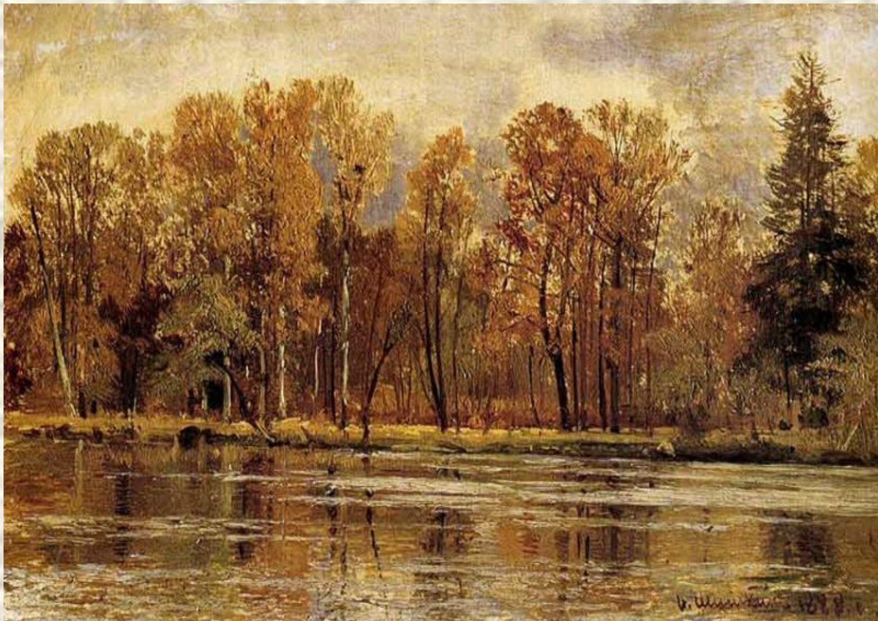
«ЗОЛОТАЯ ОСЕНЬ» И. ШИШКИН