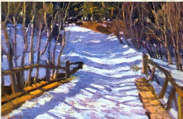
В. ГАВРИЛОВ «Голубые тени»