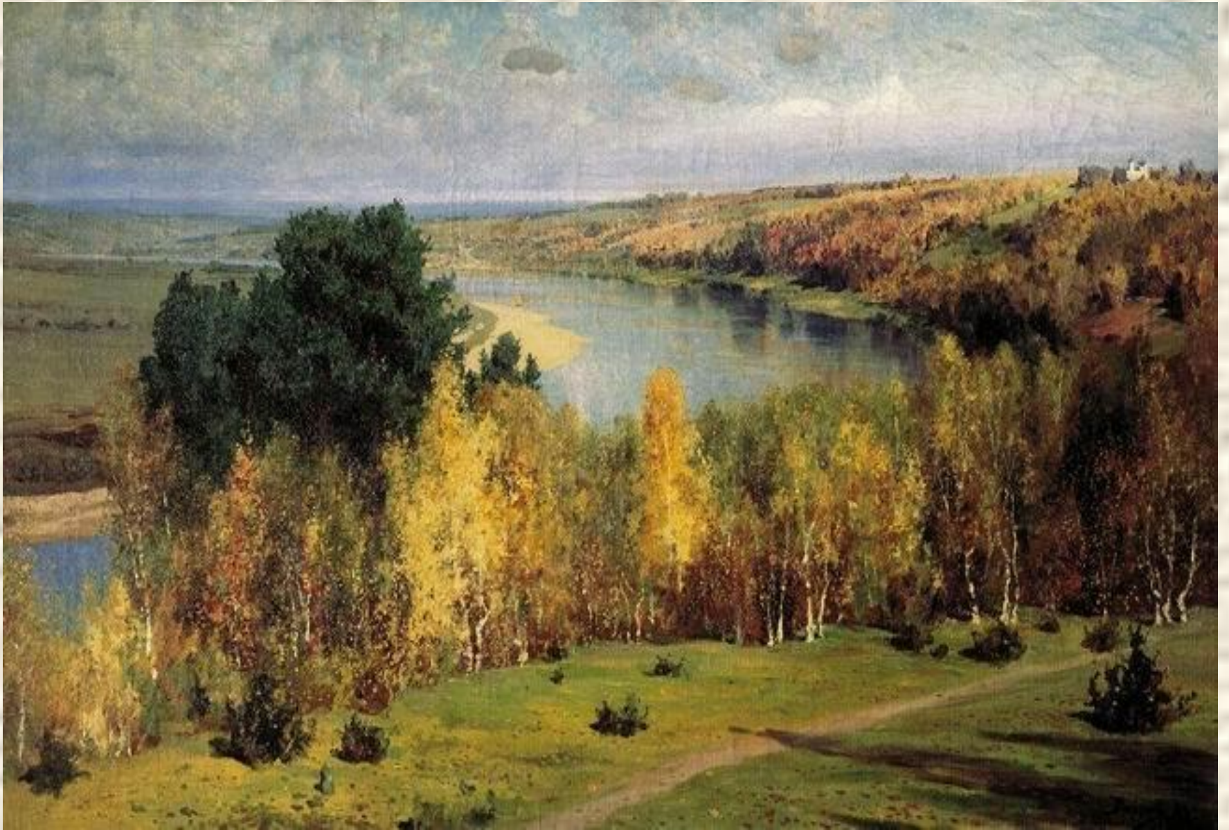
«ЗОЛОТАЯ ОСЕНЬ» В. ПОЛЕНОВ