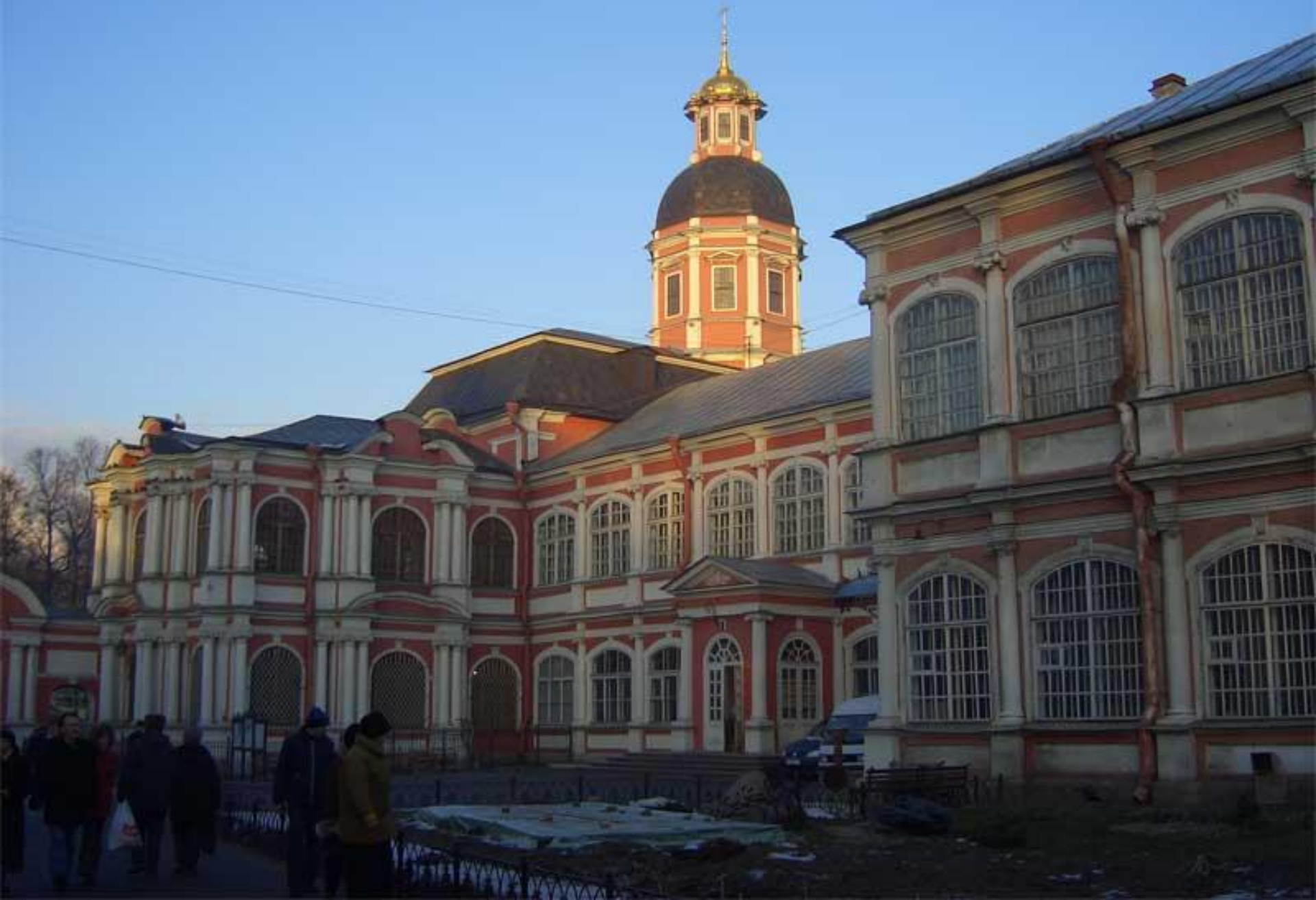
Александро – Невская лавра. Петербург.