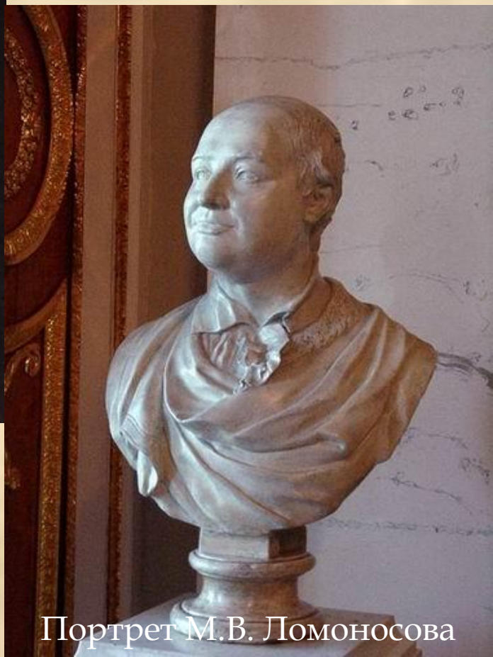
Портрет М.В. Ломоносова