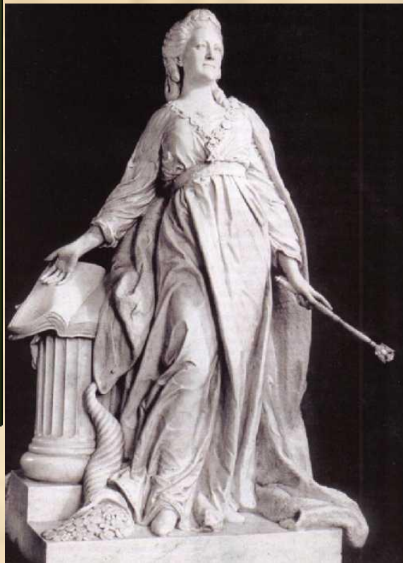
Екатерина - законодательница