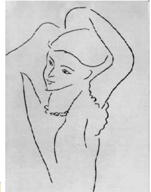
А. Матисс. Одевающаяся женщина. Ок. 1940. Б., тушь, перо. ГМИИ