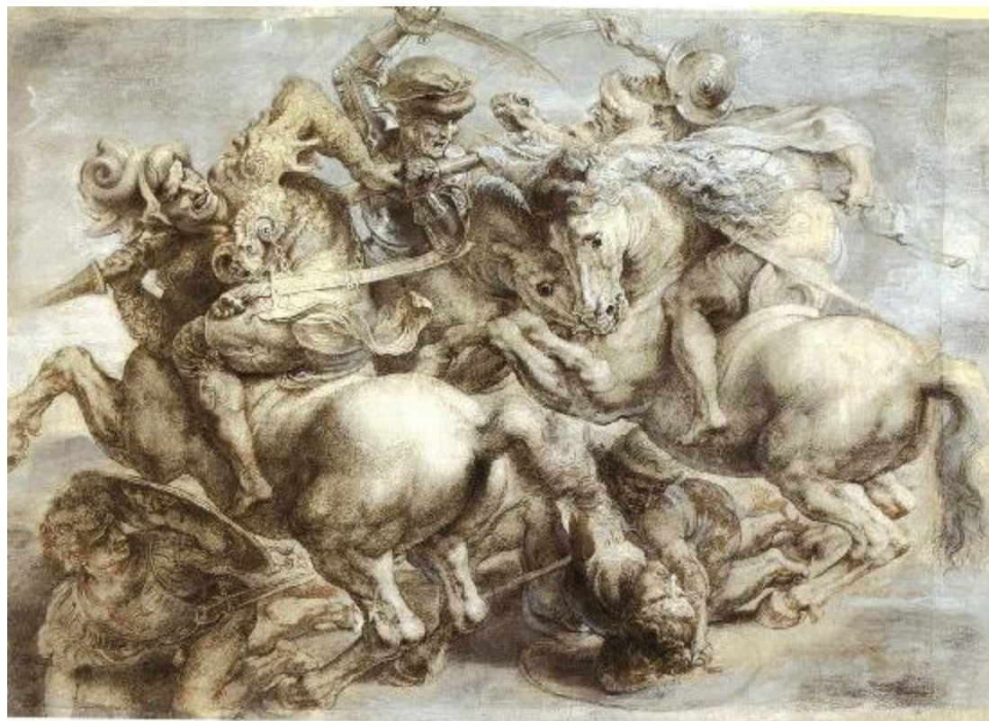
Рисунок Леонардо Рисунок Леонардо