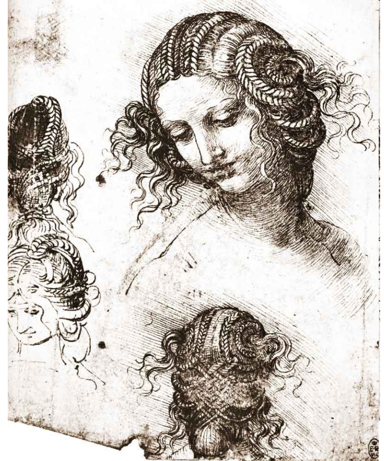
"Леда и лебедь". Фрагмент.

Леда – жена царя Спарты Тиндарея, упоминается в «Илиаде» и «Одиссее».