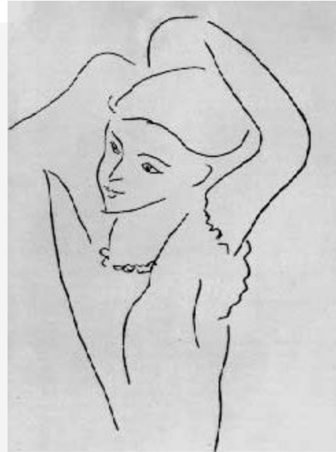
А. Матисс. Одевающаяся женщина. Ок. 1940. Б., тушь, перо. ГМИИ