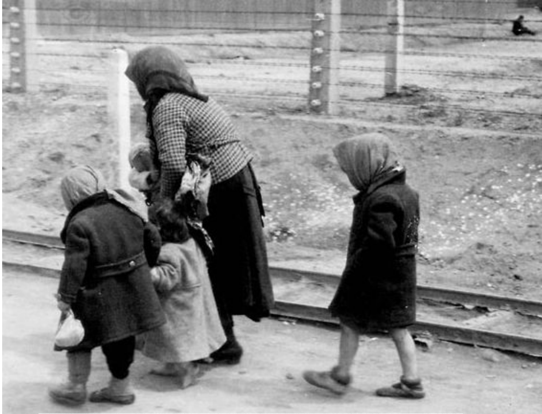
Аушвиц-Биркенау, Польша. Женщина и дети, признанные непригодными к работе, на пути в газовые камеры.