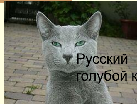
Русский голубой кот