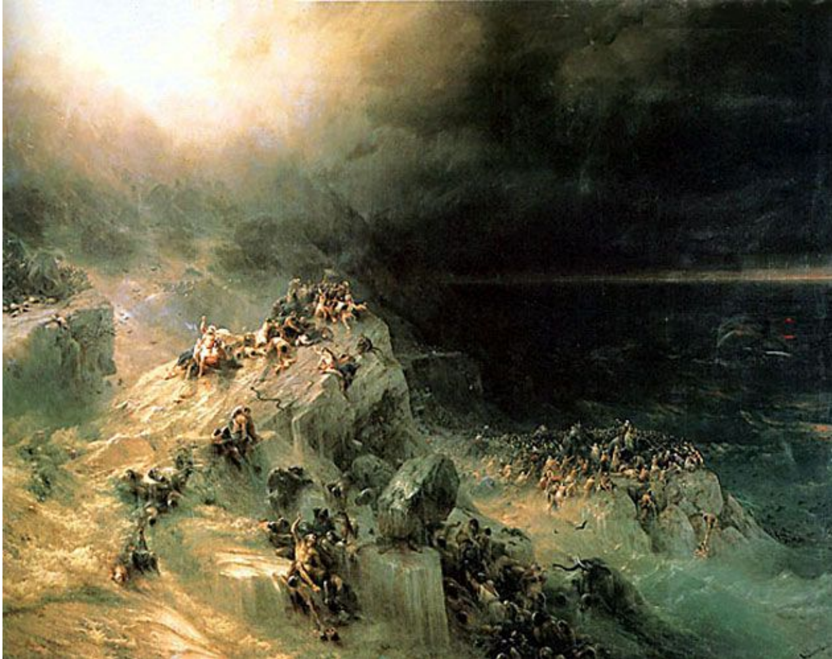
"Всемирный потоп" 1864 Айвазовский