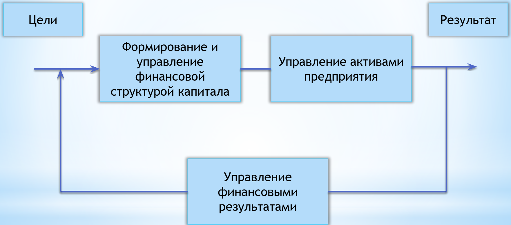
СХЕМА ФИНАНСОВОГО МЕНЕДЖМЕНТА