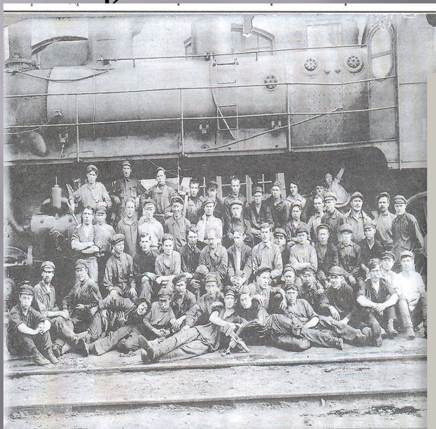
Инские железнодорожники в 1941 год.