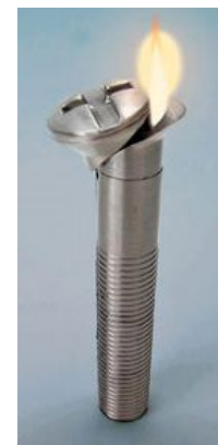
Зажигалка в виде болта