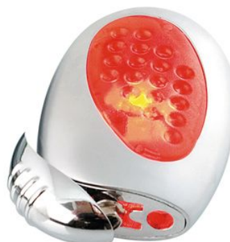
Зажигалка «Классика» с подсветкой