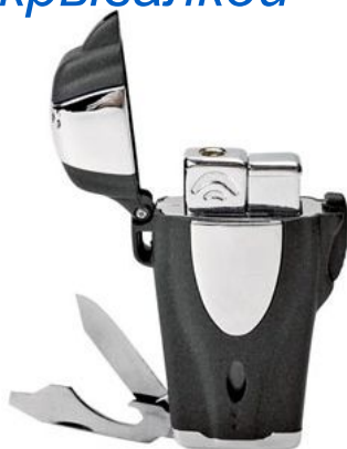
Зажигалка с ножом, пилочкой для ногтей и открывалкой