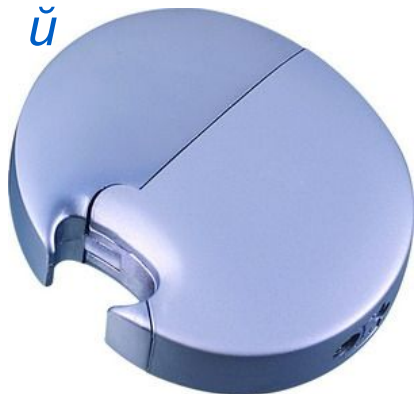
Зажигалка с открывалкой й