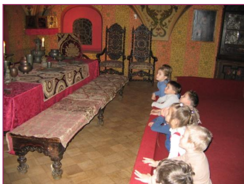
Дом бояр Романовых