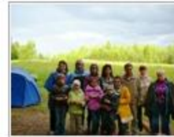
Отдых в летнем лагере. Радуга