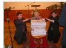
Молитва над газетами