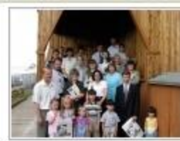
Читатели из Якутии

Та знімає цикл телепередач за листами читачів