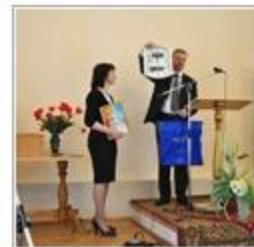
Самое дорогое в нашей жизни - время