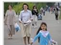
В поисках будущих читателей