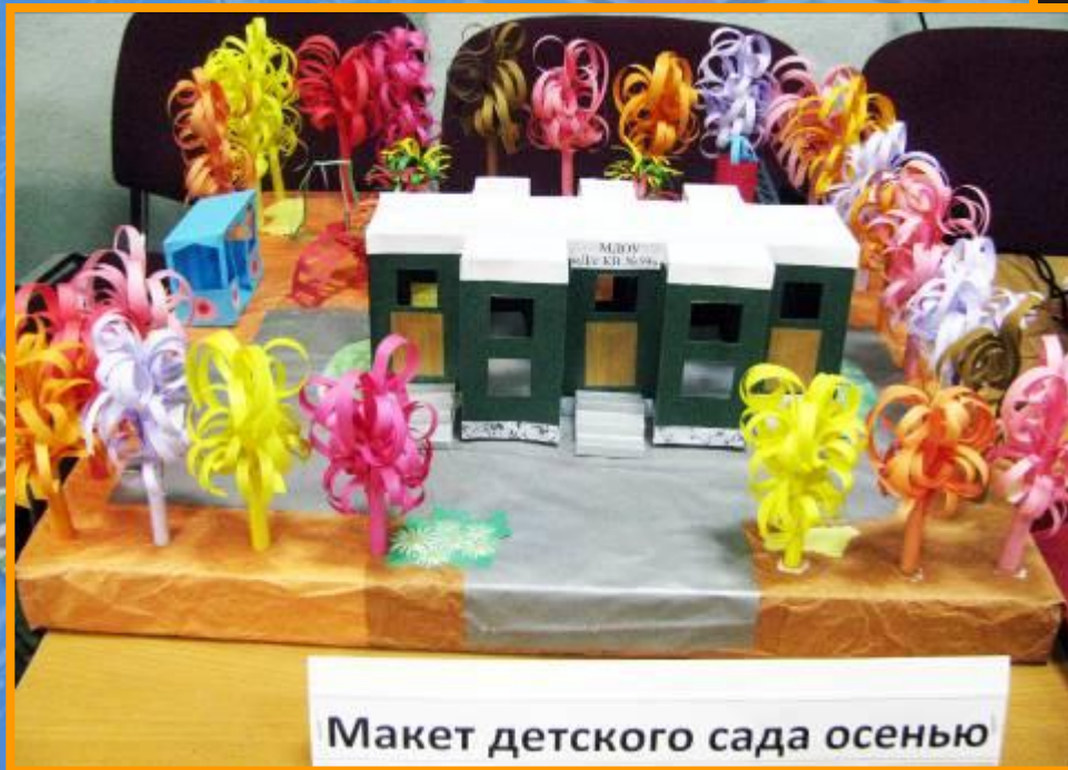
Макет детского сада осенью