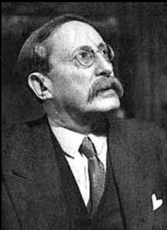
ЛЕОН БЛЮМ - ПРЕМЬЕР-МИНИСТР ФРАНЦИИ.