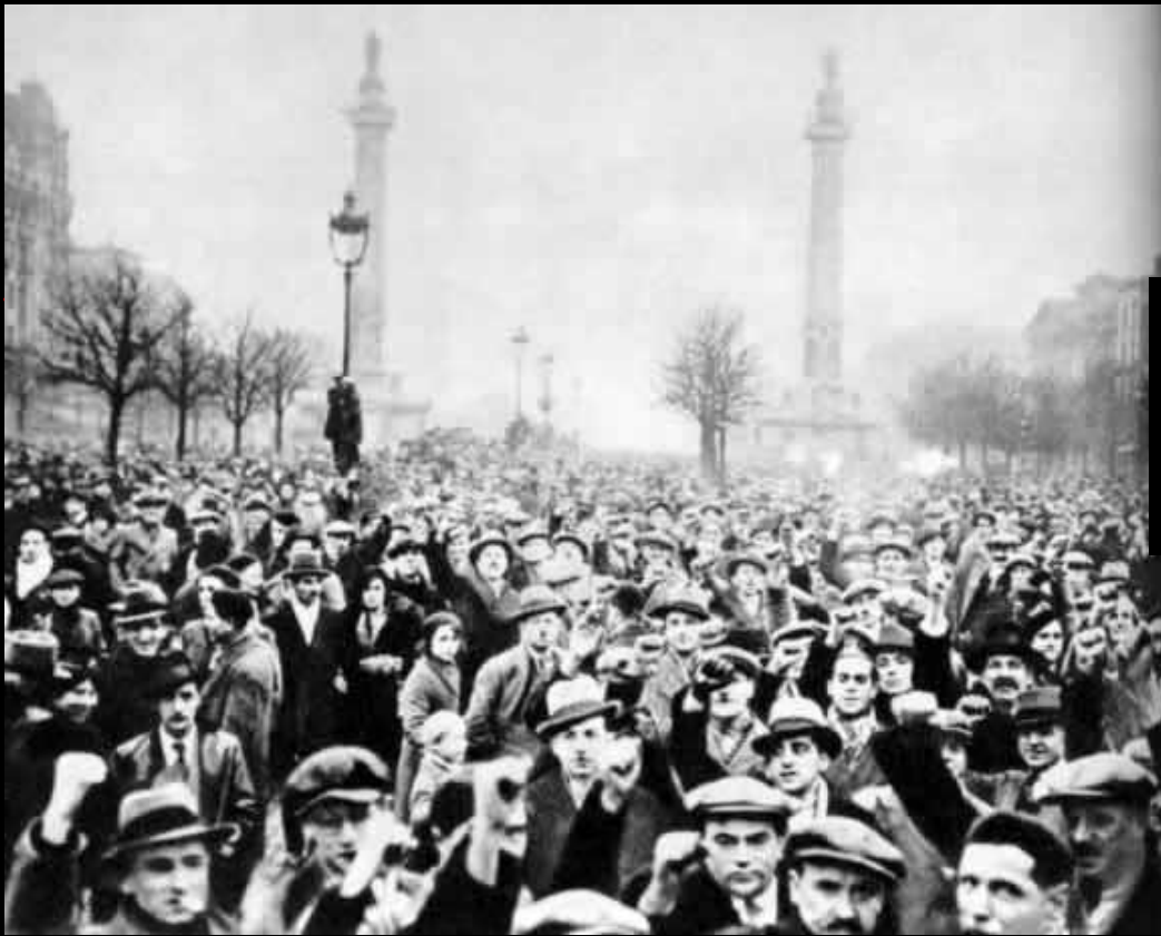
Демонстрация французского пролетариата против попытки фашистского переворота. Париж. 1934 г.