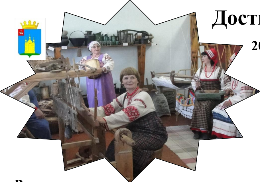
Выставка художественного народного творчества «Семейные реликвии»