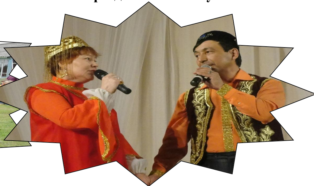
Развитие этнокультурных традиций