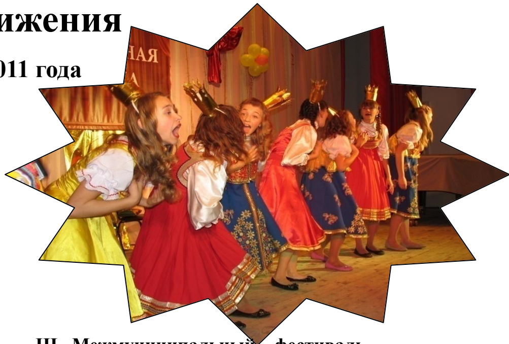
III Межмуниципальный фестиваль «Театральная ярмарка»