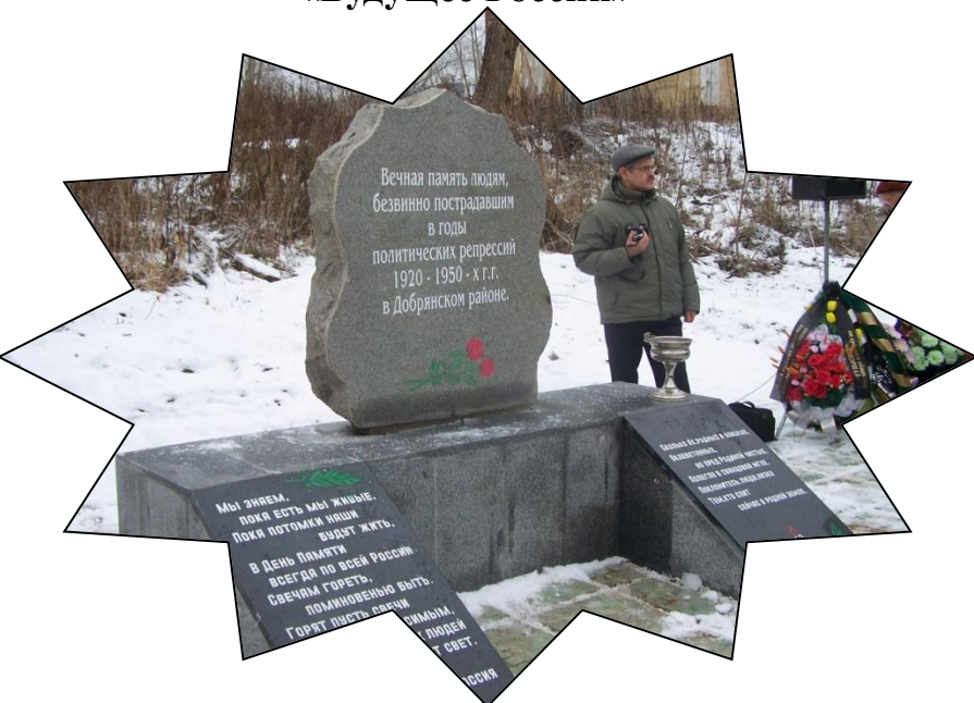
Открытие памятника жертвам политических репрессий