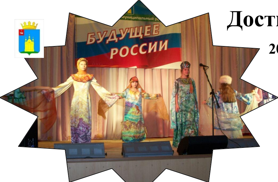
Чествование талантливой молодежи «Будущее России»