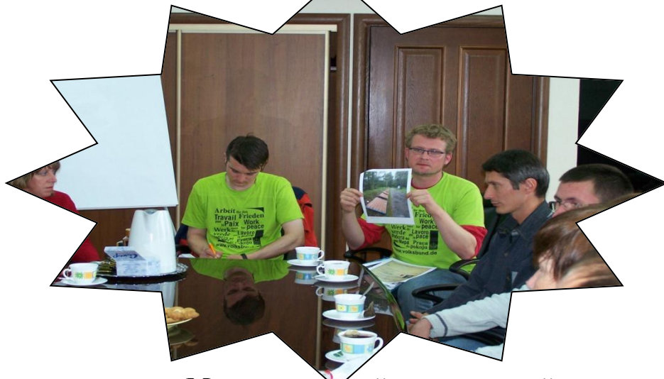
Международный молодежный волонтерский лагерь «Квартира»