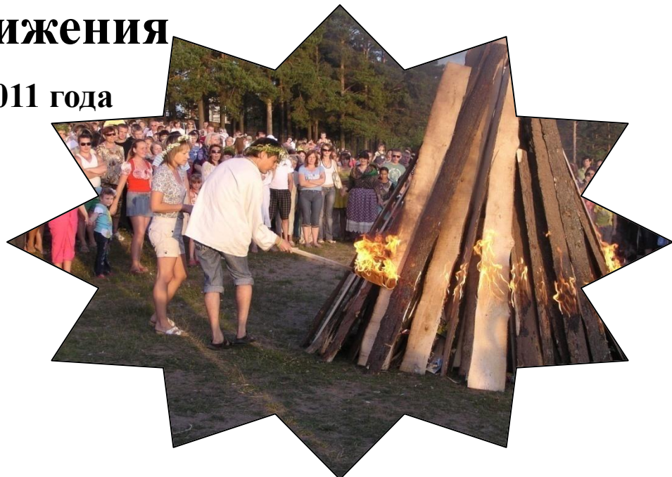
Праздник Ивана Купалы