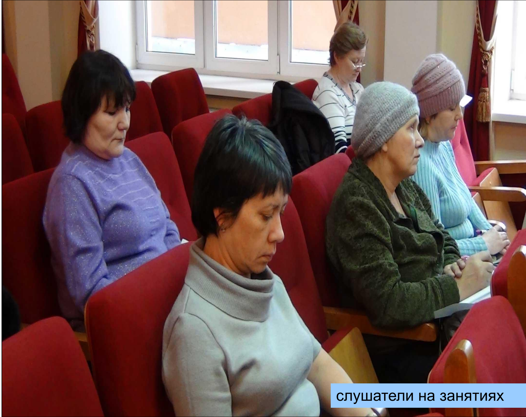
слушатели на занятиях