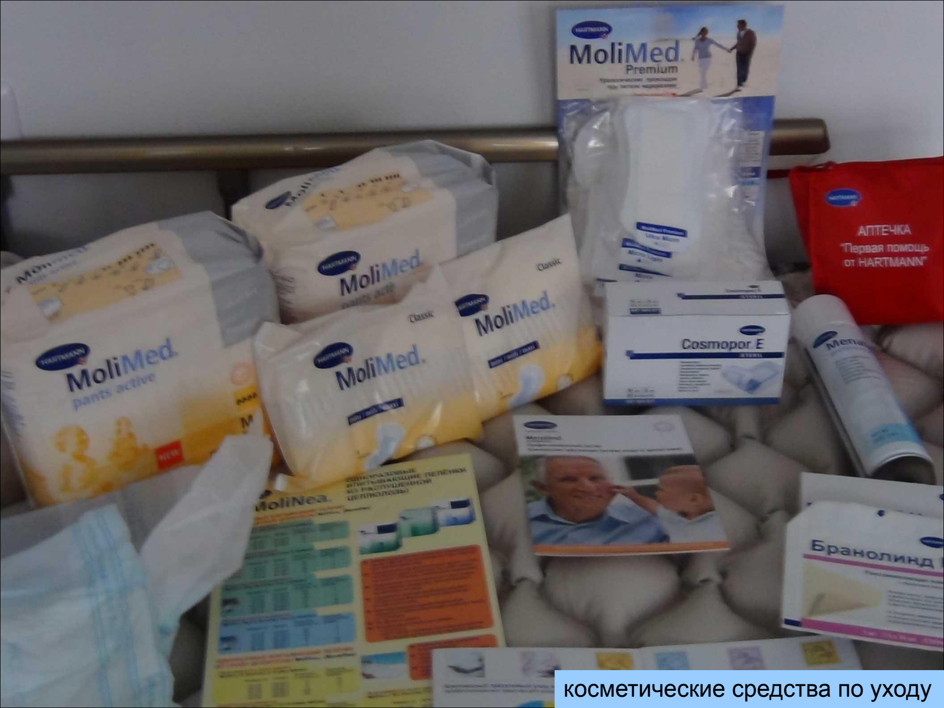
косметические средства по уходу