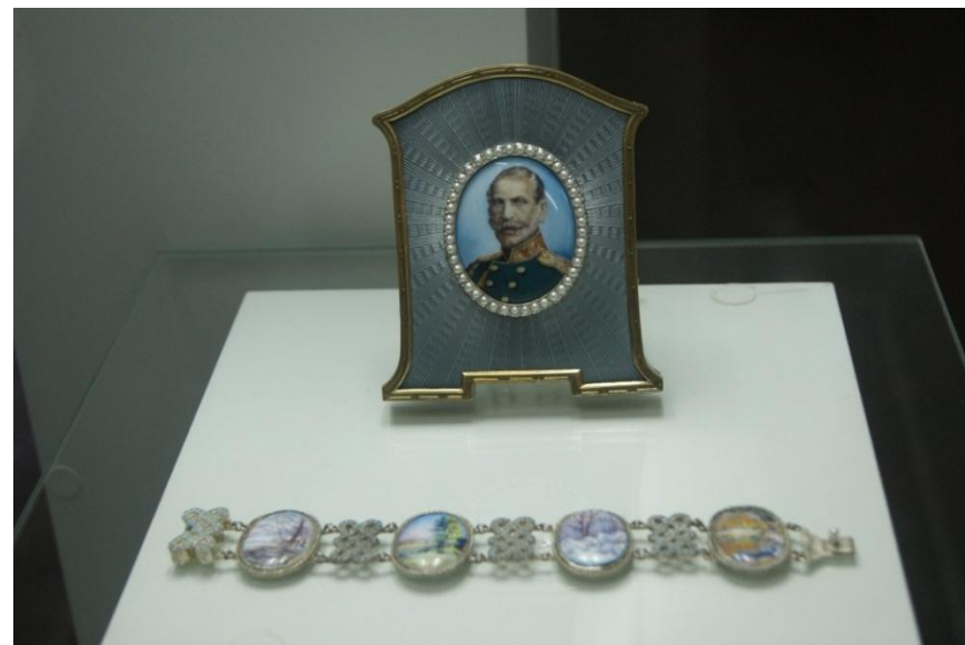
Выставка «Строгановское серебро» (серебряные предметы династии Строгановых из Московских коллекций)