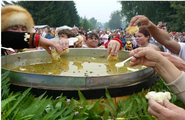
Освящение заповедного мёда