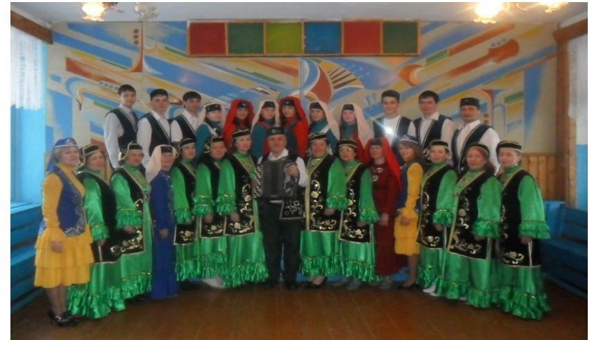
Хоровой коллектив Чайкинского сельского Дома культуры