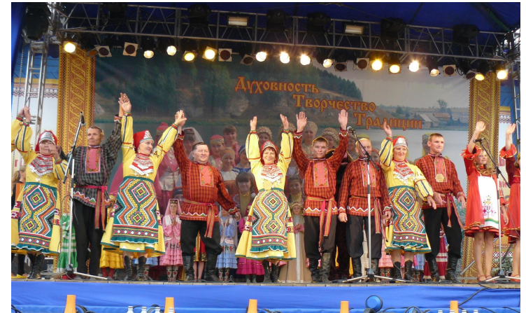
Тур творческих коллективов Пермского края «Мы все такие разные, но всё-таки мы вместе»