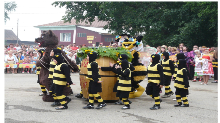
Дары «Медовой Столицы»