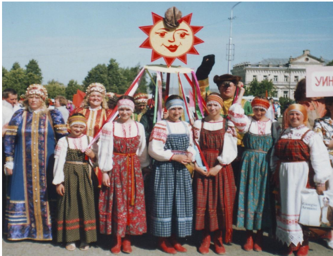
Образцовый детский ансамбль «Жаворонки»