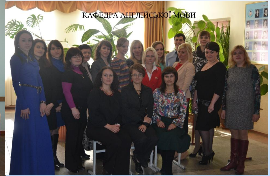
КАФЕДРА АНГЛІЙСЬКОЇ МОВИ