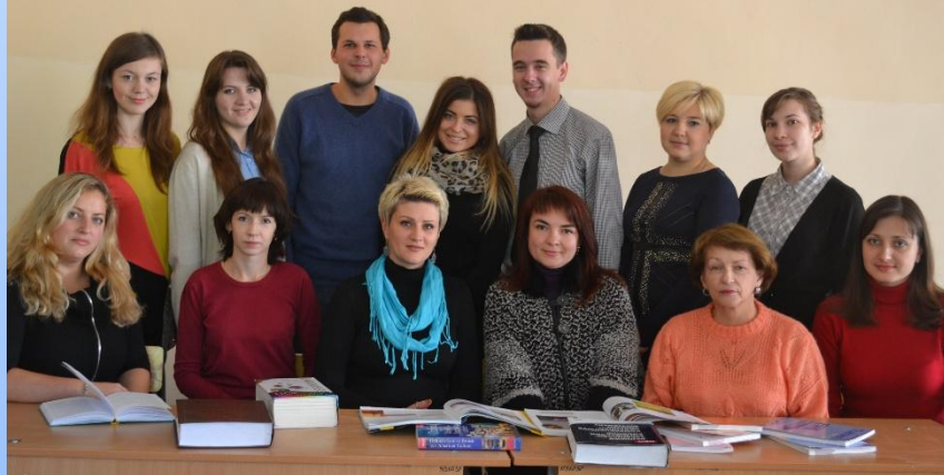
КАФЕДРА ІНОЗЕМНИХ МОВ ТА ІННОВАЦІЙНИХ ТЕХНОЛОГІЙ НАВЧАННЯ