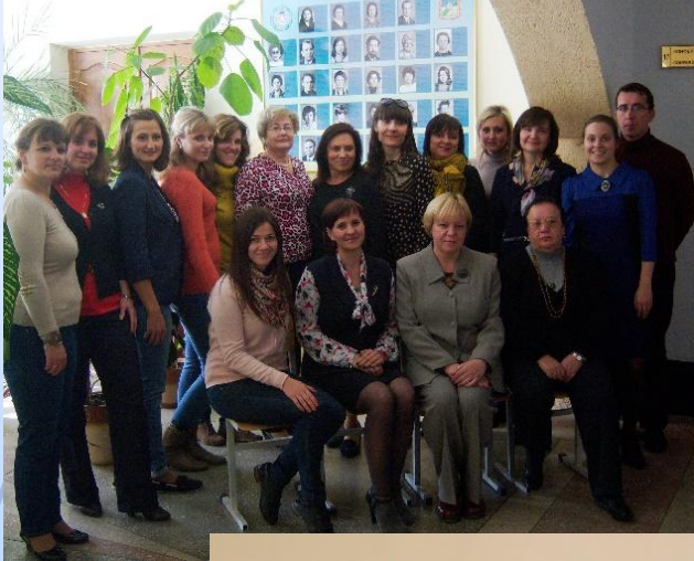
КАФЕДРА МІЖКУЛЬТУРНОЇ КОМУНІКАЦІЇ ТА ПРИКЛАДНОЇ ЛІНГВІСТИКИ