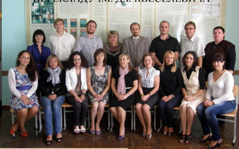
КАФЕДРА АНГЛІЙСЬКОЇ ФІЛОЛОГІЇ ТА ПЕРЕКЛАДУ ІМ. Д.І. КВЕСЕЛЕВИЧА