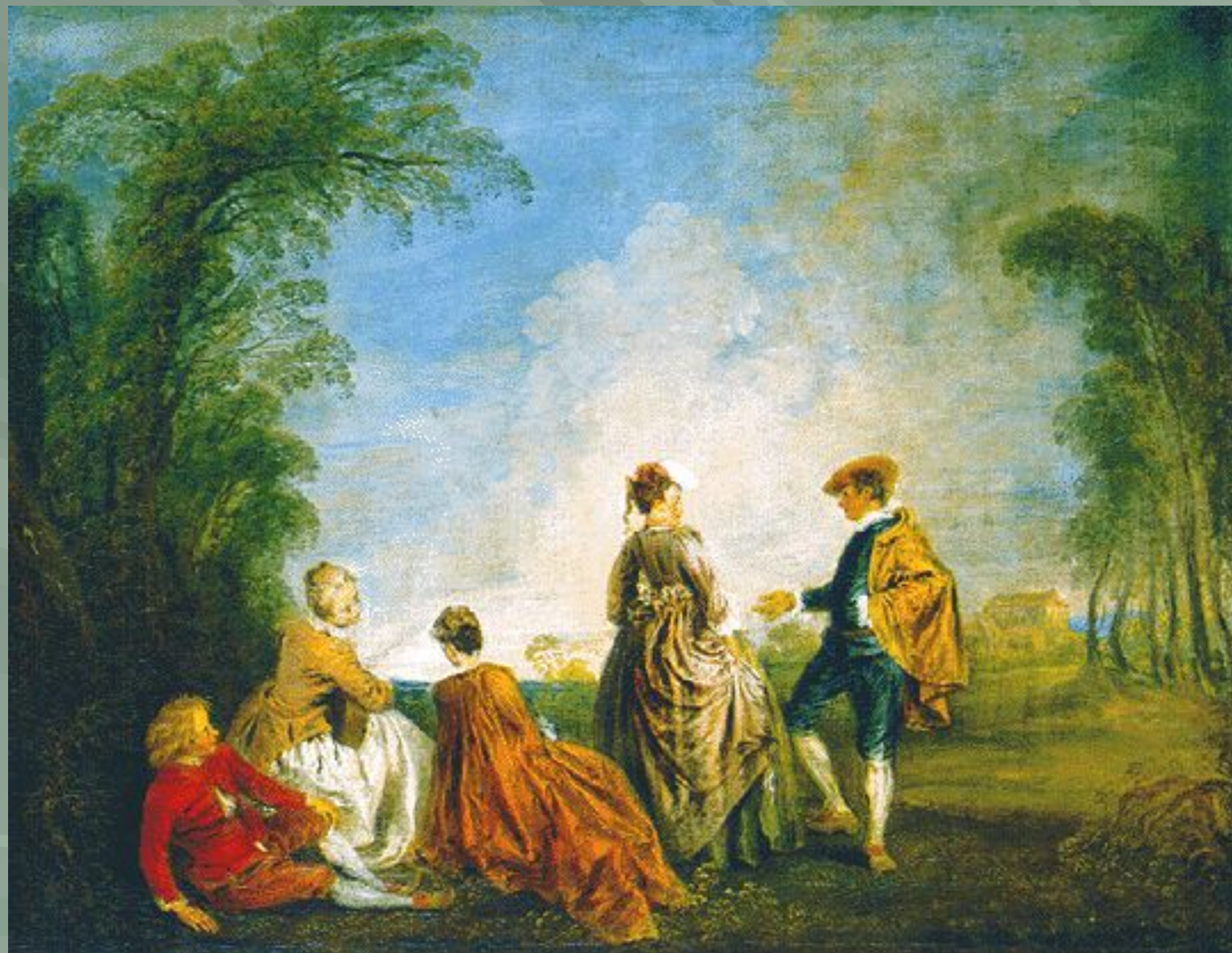
« Затруднительное предложение »