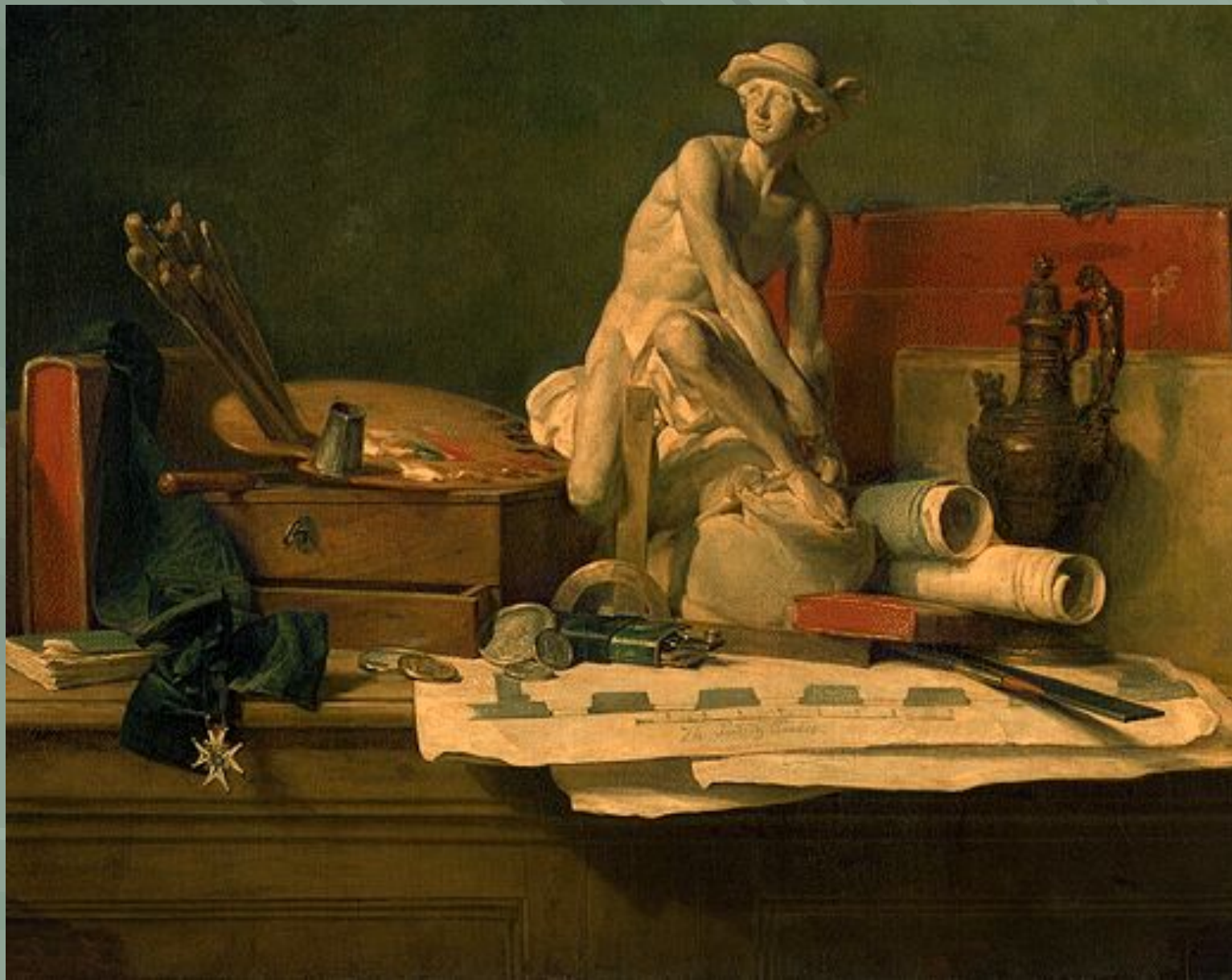
«Натюрморт с атрибутами искусств»