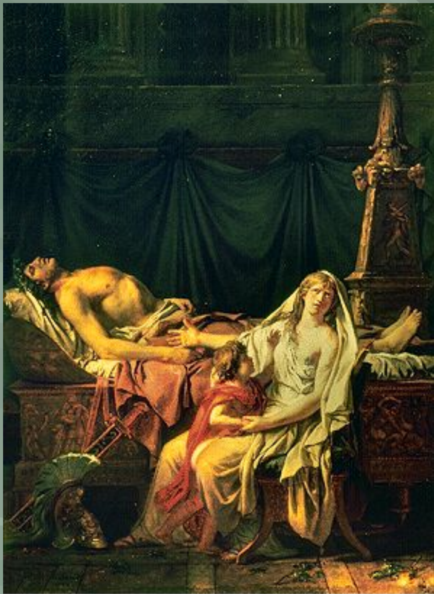
« Андромаха, оплакивающая Гектора»