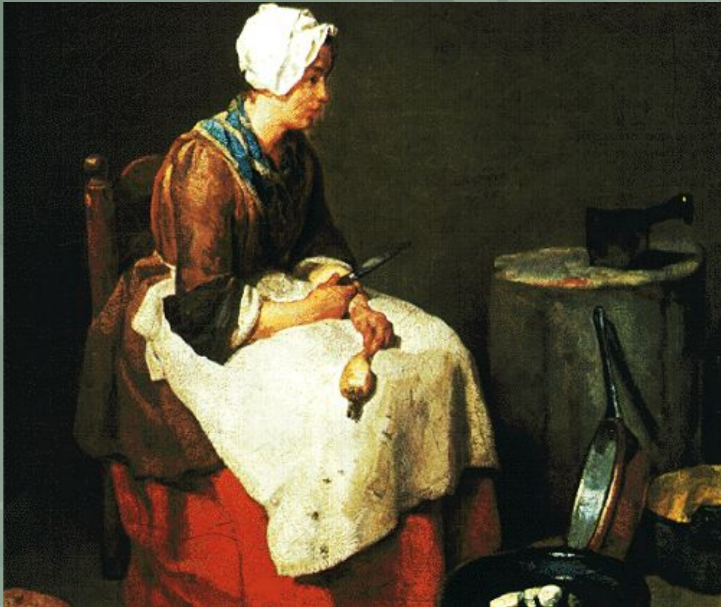
«Торговка жареным мясом»