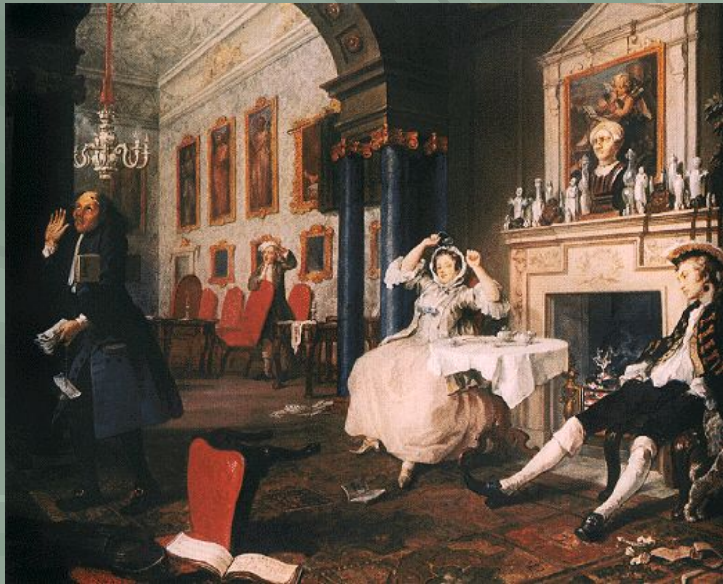
«Утро в доме новобрачных»