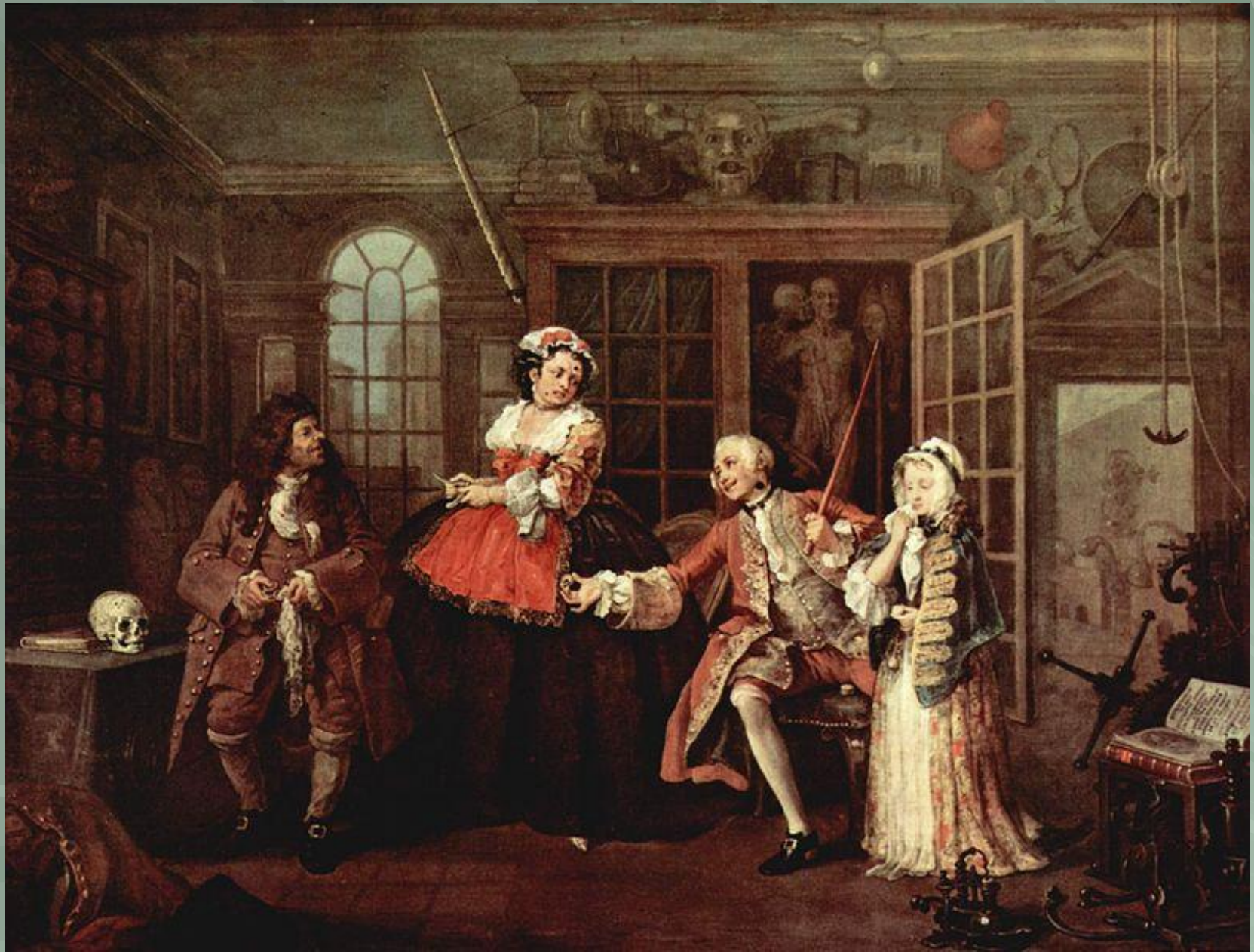
«Визит к шарлатану»