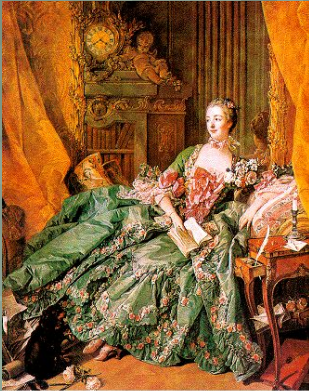
« Графиня де Помпадур»