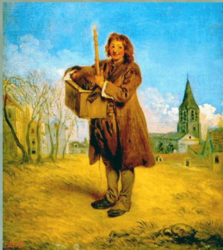
«Савояр с сурком»