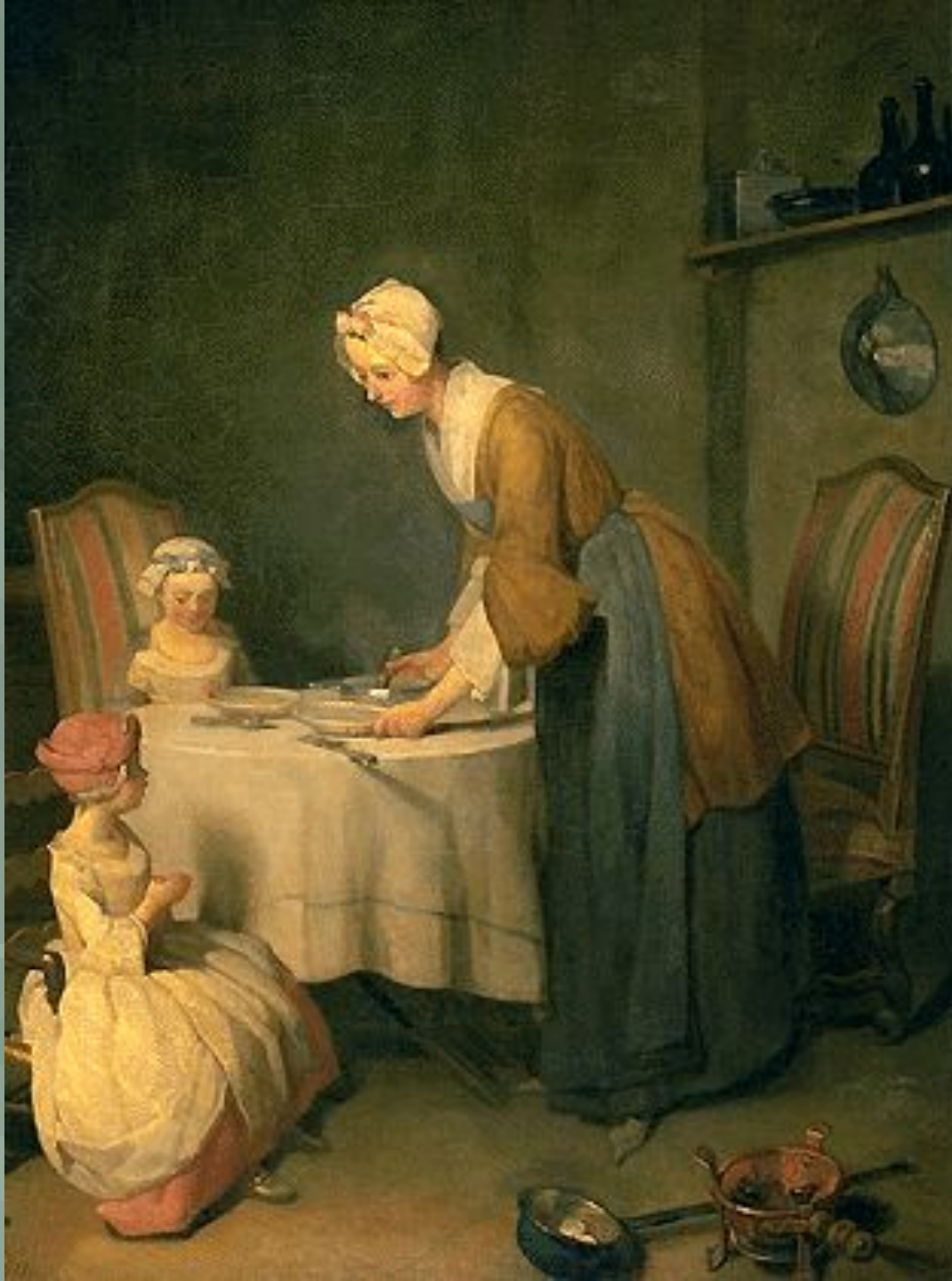
«Молитва перед обедом»