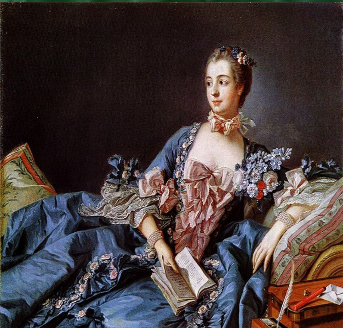
Франсуа Буше. Портрет мадам Помпадур, около 1750 года.