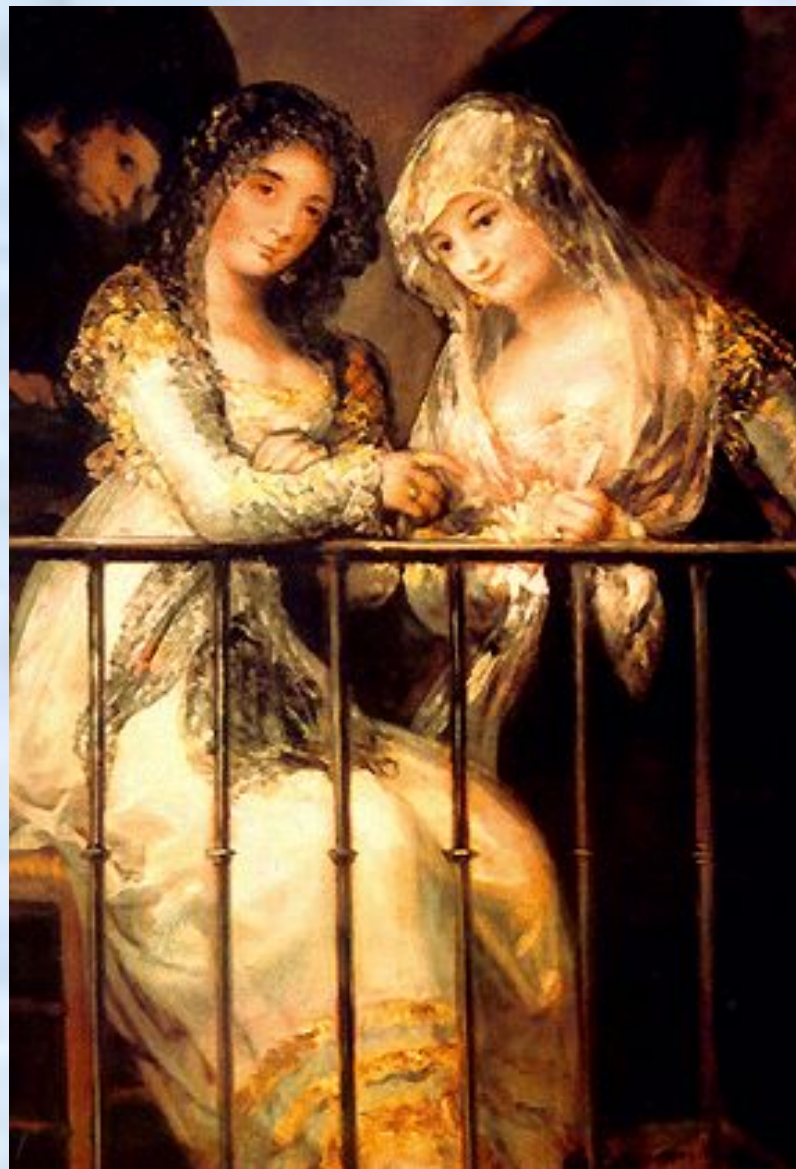
Махи на балконе