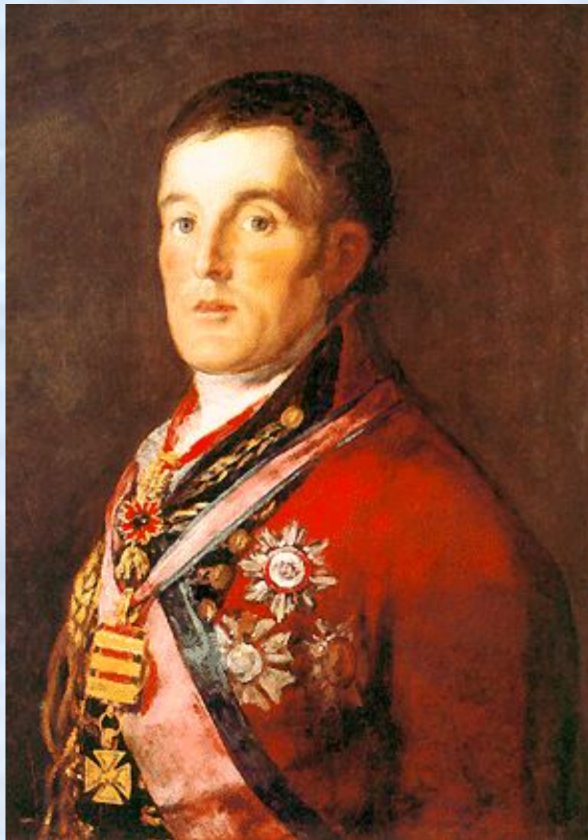
Портрет герцога Веллингтона