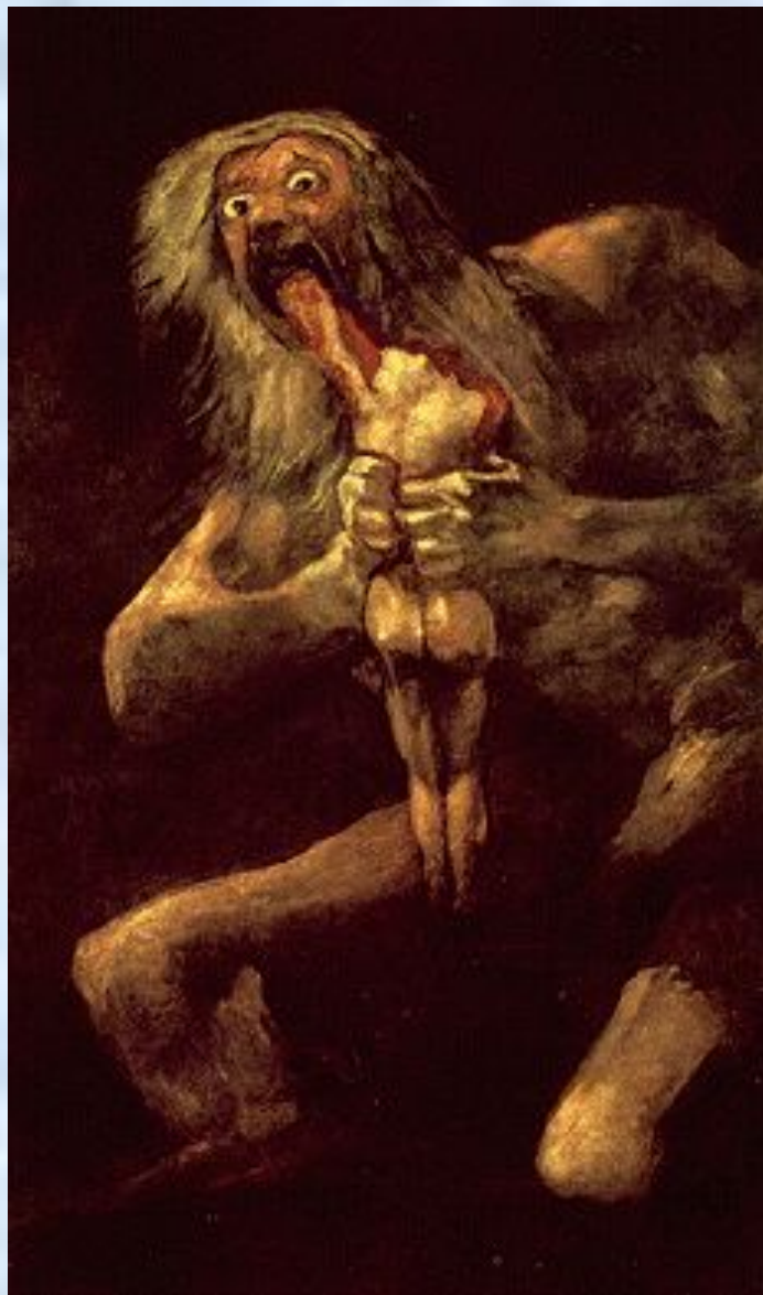
Сатурн, пожирающий своих детей