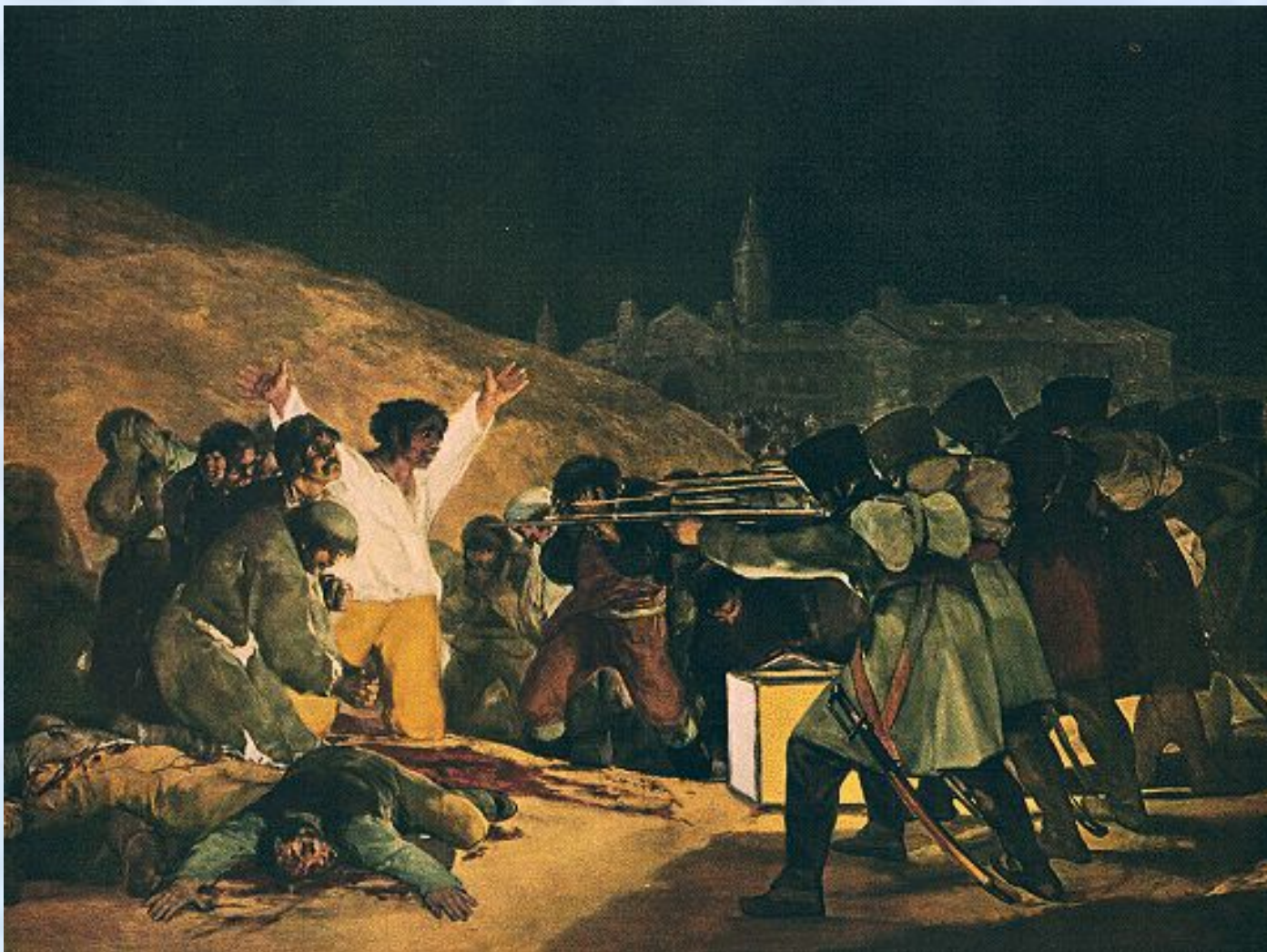
Расстрел повстанцев в ночь на 3 мая 1808 года