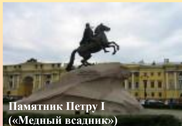
Памятник Петру I («Медный всадник»)