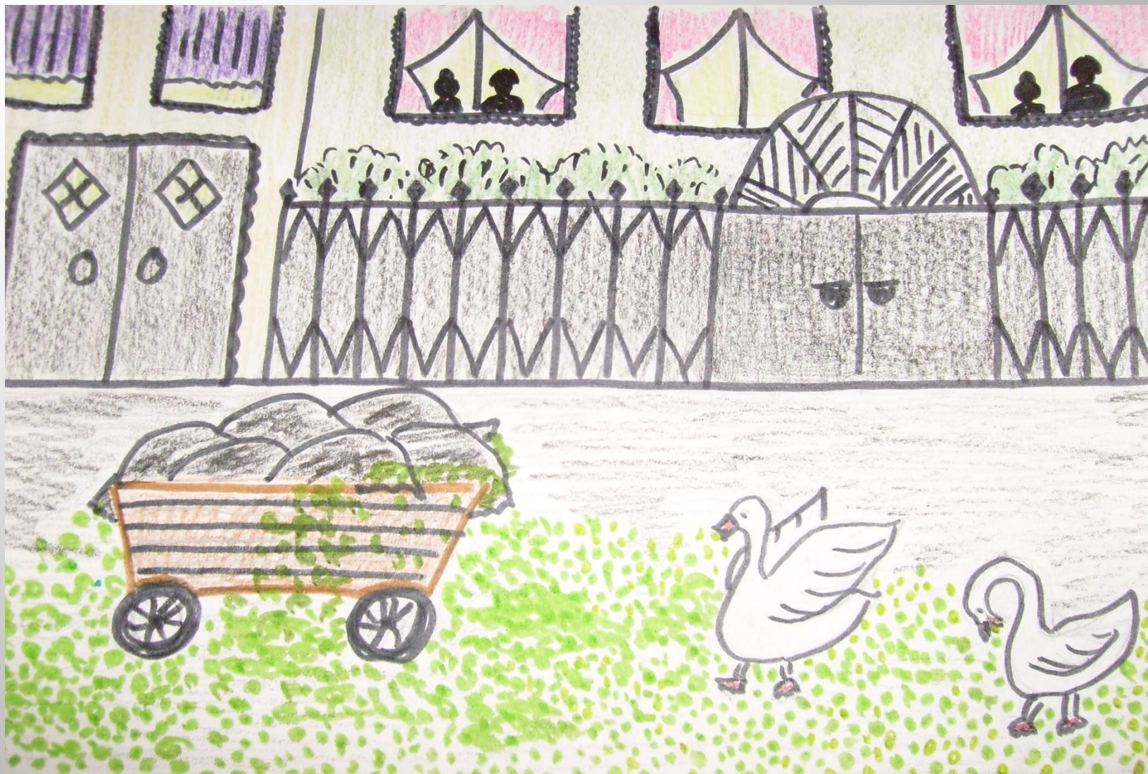
Иллюстрация к сказке