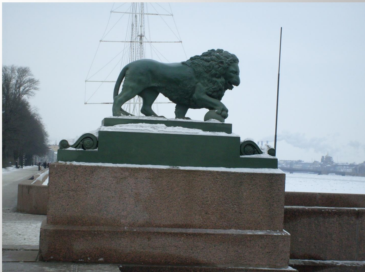
Львы у Дворцовой пристани