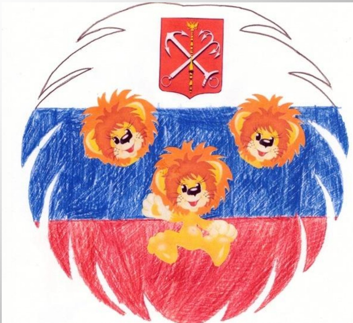
Рисунок – коллаж Ольги Б., 3-А класс