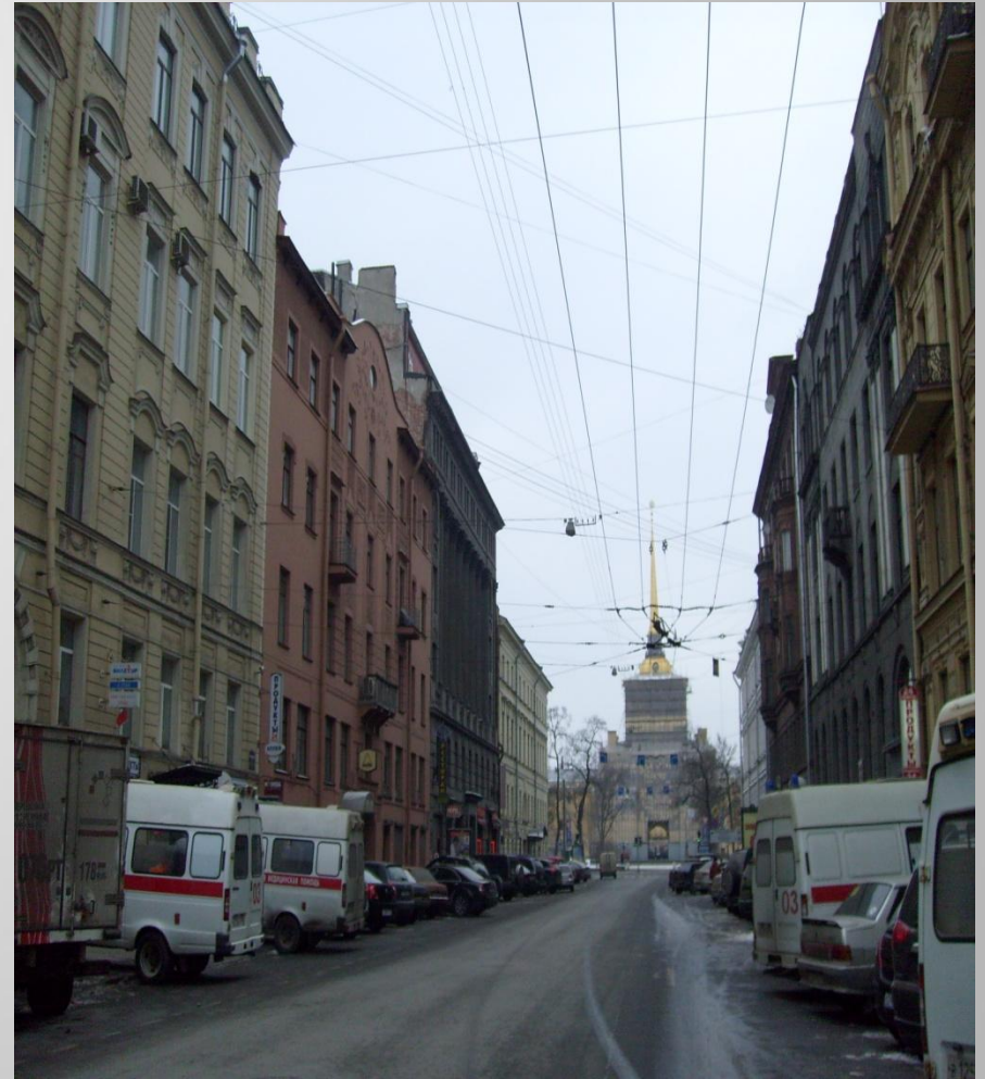
Вид на Адмиралтейство с Гороховой улицы