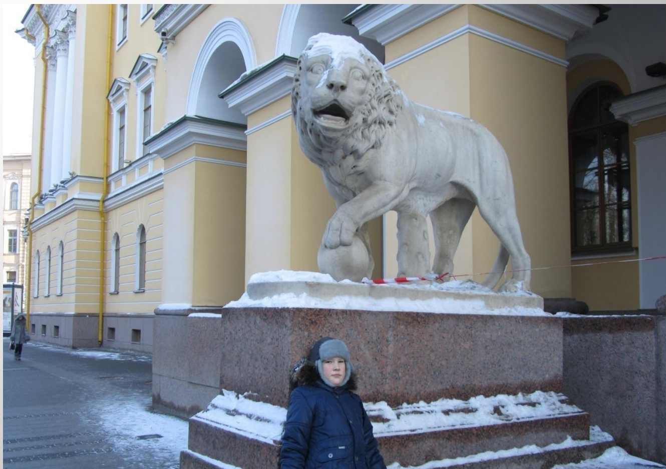
Мраморные львы на Адмиралтейском проспекте у дома Лобанова-Ростовского