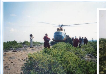
Обоо Чингисхана The Top of Chingiskhan