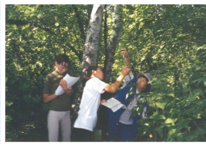
Черёмуховая падь The Bird Cherry Tree Forest