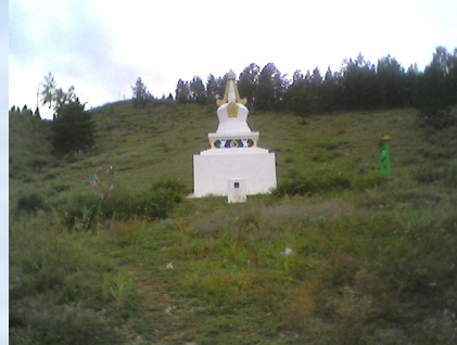
Шэнэһэтэ The Grove Shenehete