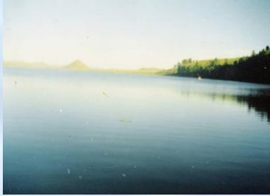
Карасиное озеро Crucian Lake