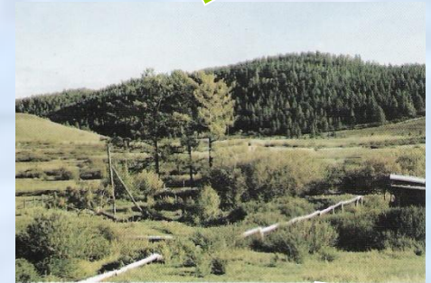
Аршан Ухаа Толгой The Source Ukhua-Tolgoi