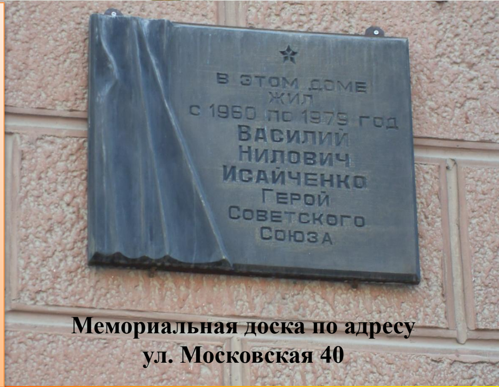
Мемориальная доска по адресу ул. Московская 40