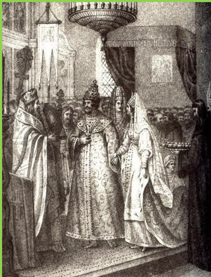
Свадьба Иоанна III Васильевича и Софии Палеолог (1472г.)