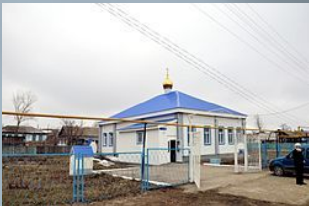
Церковь в Баймаке