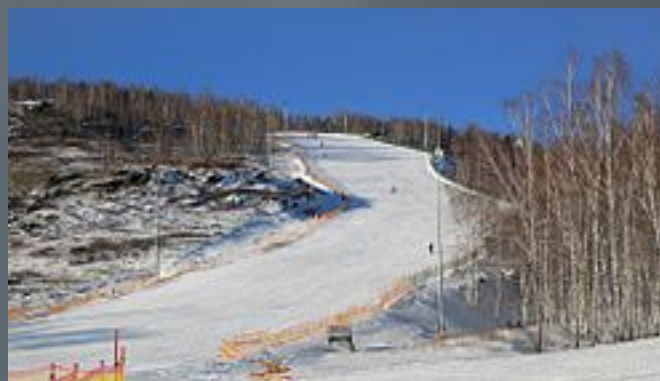
Банное горнолыжный центр