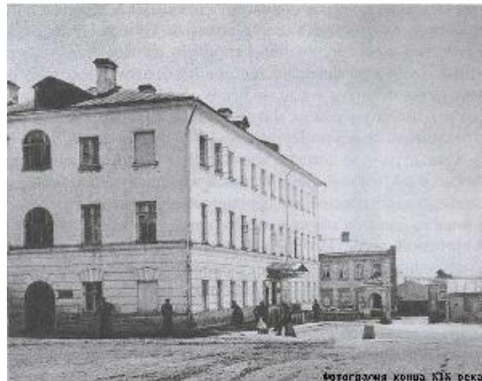
Фотография конца XIX века.