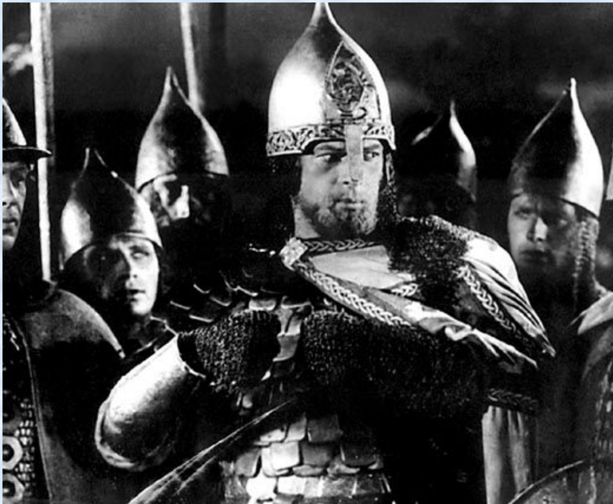
Николай Черкасов в фильм Сергея Эйзенштейна "Александр Невский"