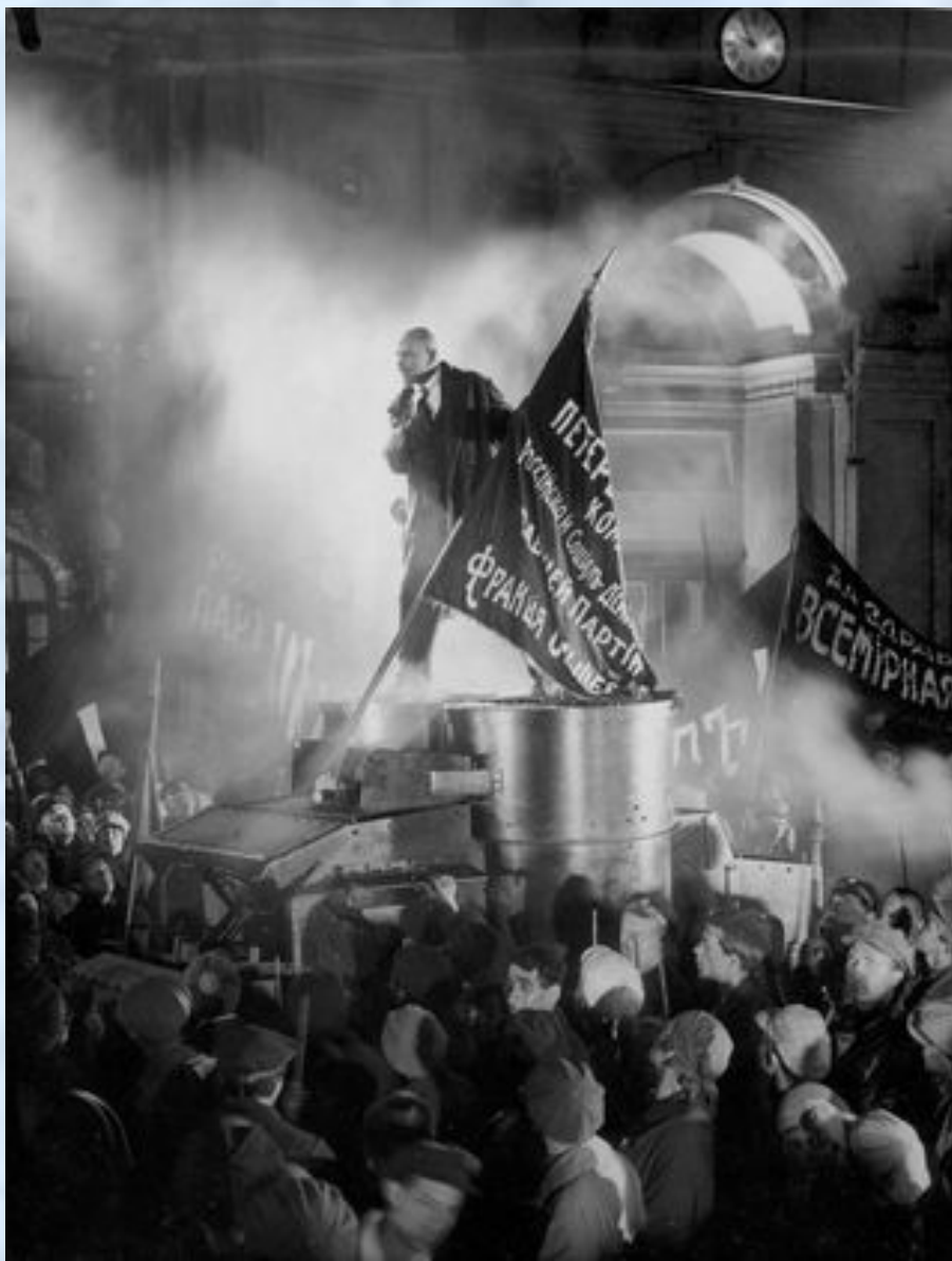
Эйзенштейн — Октябрь (1927)

Историко-революционный фильм, снят к 10-летию Октябрьской революции. События 1917 года, итогом которых стал залп крейсера "Аврора" и штурм Зимнего дворца, были восстановлены с максимальной точностью.