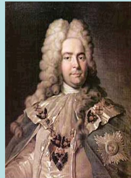
П. И. Ягужинский