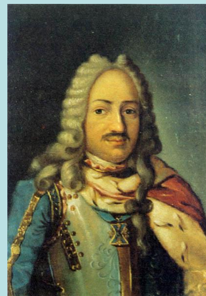
Франц Яковлевич Лефорт