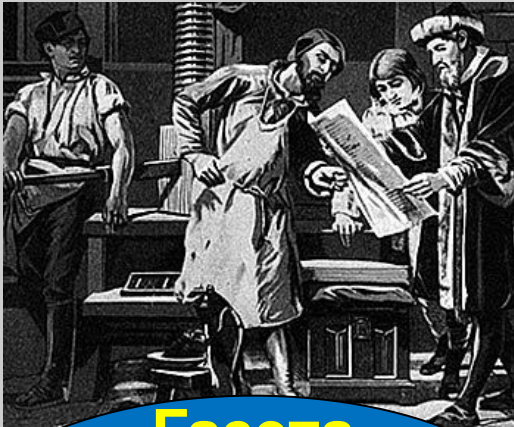
Газета «Ведомости » 1702г