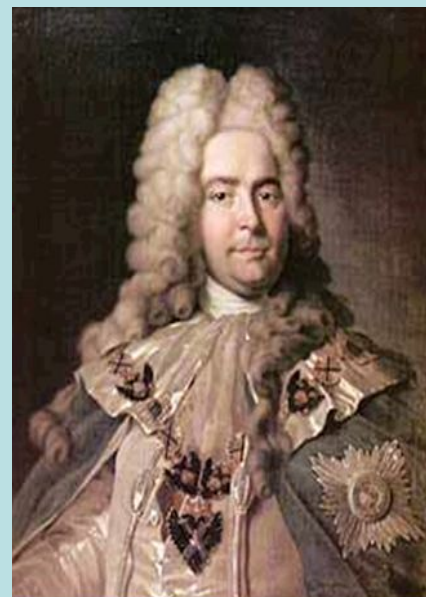
П. И. Ягужинский