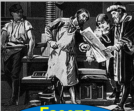
Газета «Ведомости » 1702г