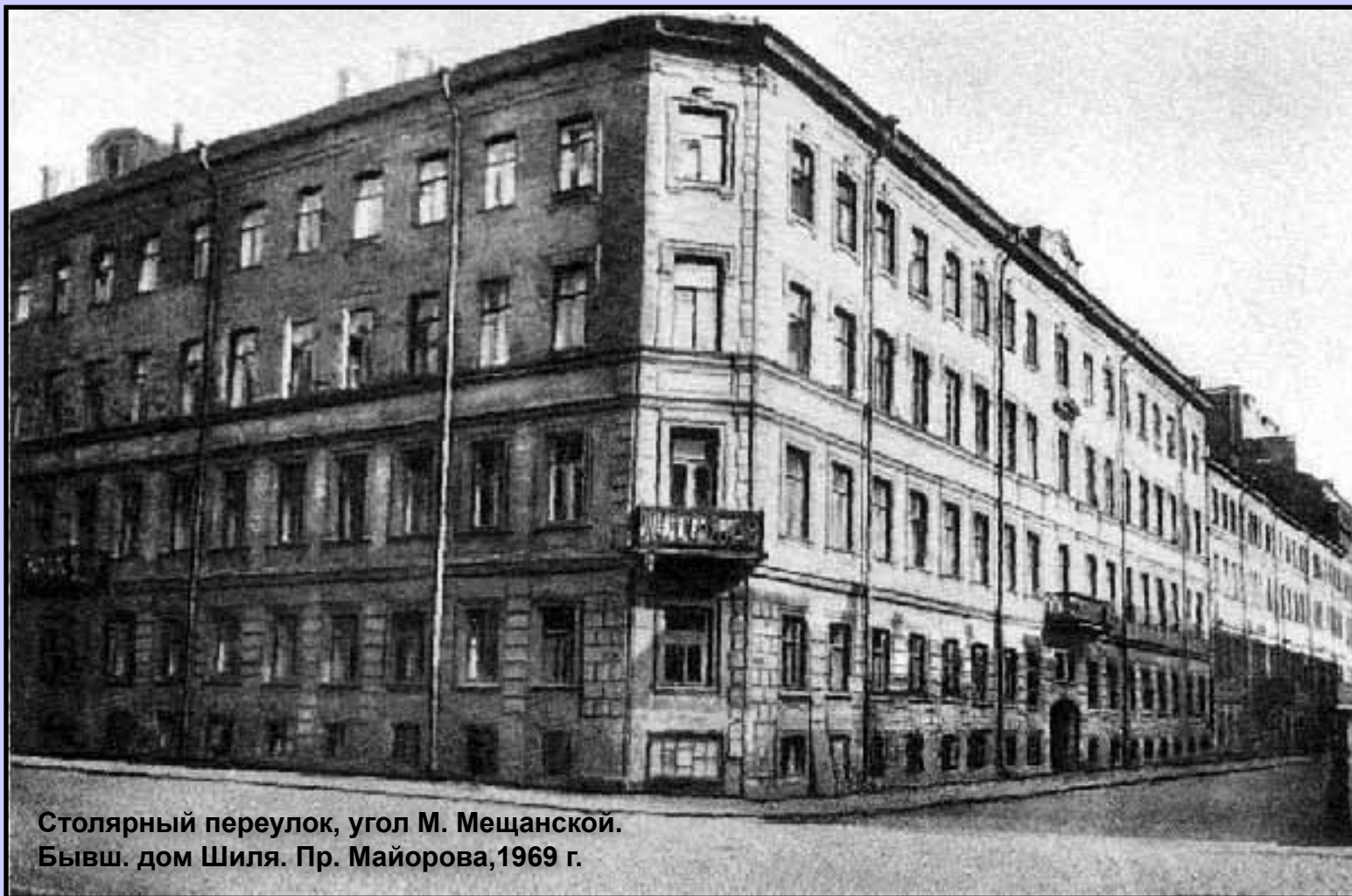
Столярный переулок, угол М. Мещанской. Бывш. дом Шилия. Пр. Майорова, 1969 г.

В Столярном переулке, в доме №19/5 Достоевский поселил Раскольника. «Во внутреннем дворе, справа, есть парадная. Там, на последнем этаже, тринадцать ступеней ведут наверх, в квартиру Раскольника».